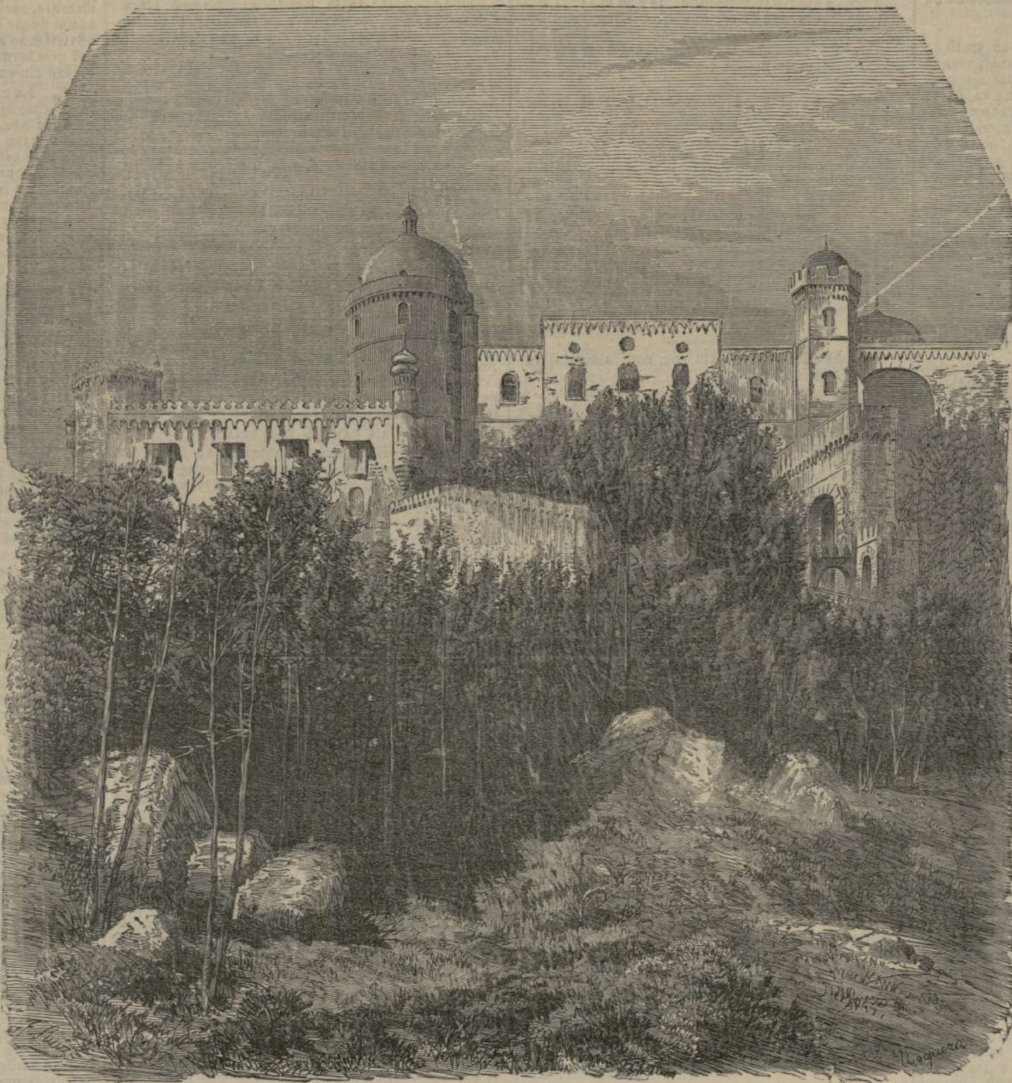
El palacio «Da Penha» en Cintra.

El tribunal no ha apreciado las razones del reo, quien alegó que solo pensaba «aburrirse» de los prusianos, sacándoles los cuartos y no dándoles el cartucho.