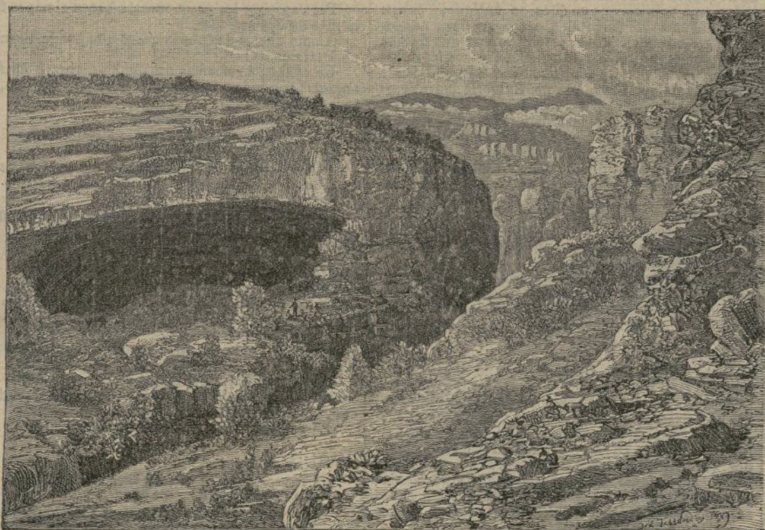
La gruta de Solencio en Aragón.

Fórmale una colección de biografías de los hijos de aquella provincia que en ciencias, artes, política, religión, industrias, ó en cualquiera de las manifestaciones de la actividad humana, han merecido el calificativo de ilustres. Comenzando por el matemá-