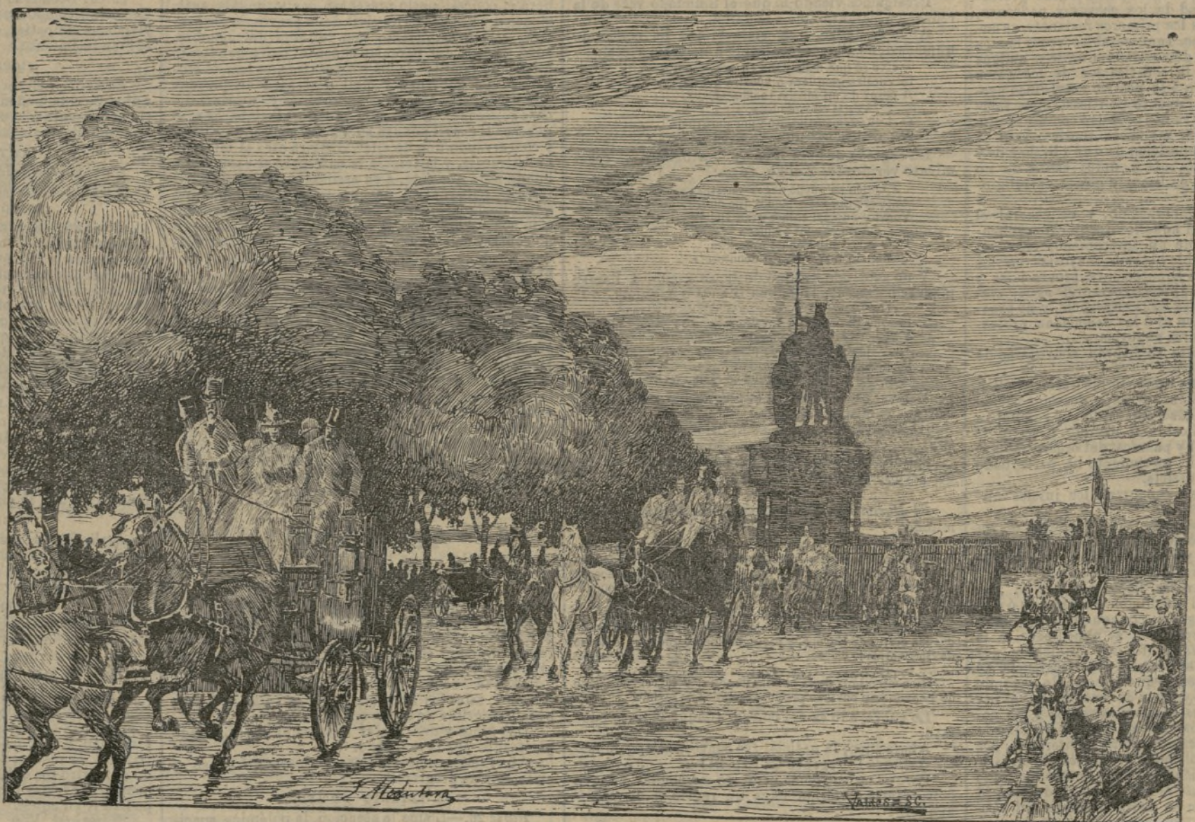
La vuelta de las carreras.

Cuando murió estaba componiendo un libro de alabanzas a la Virgen Santísima, y de 116 años, otro de diferentes asuntos. Fué Alguacil mayor de este Arzobispado; navegó muchos años; fué Religioso de San Juan de Dios; sabía siete lenguas; fué Mayor- domo del convento de Santa Ana, Escribano de Cá- mara del Acuerdo de esta Audiencia; fué Sacerdote de la Contratación, Notario mayor de la Religión de San Juan de Dios. Se ordenó de Sacerdote a la edad de 99 años; celebró hasta el fin de sus días; murió de una caída que dió en las pasaderas del Colegio de Nuestro Padre San Francisco de Paula de esta Ciudad. Se puede formar un pueblo de 300 vecinos con solo su familia.—Concuerda con el original a que me remito que queda en el Archivo de esta Igle- sia. Y para que conste, lo firmo en Sevilla a 4 de Febrero de 1789.—Dr. D. Francisco Blanco.—Es copia.»