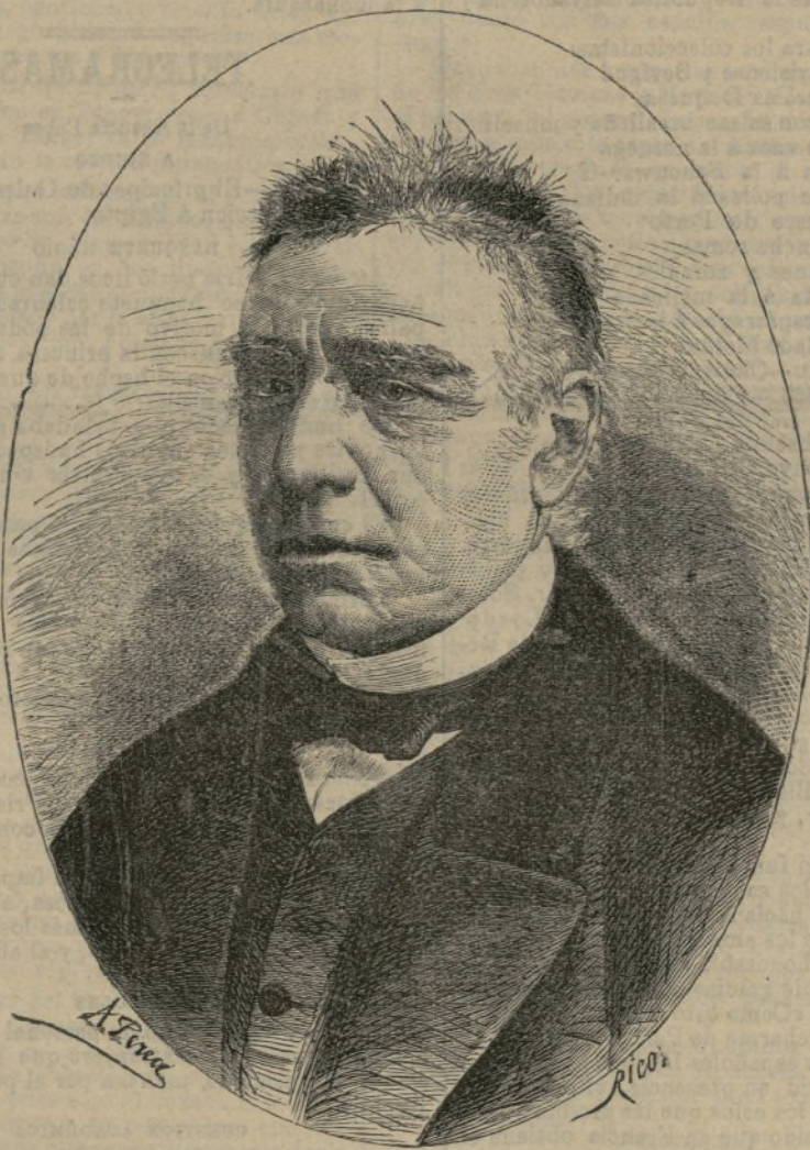
D. José María Orense.

Ya en 1844 habían obtenido fama general dos réplicas a cual más singulares y maliciosas. Contestando a un orador moderado, ganoso de demostrar que la reacción de 1844 inauguraba una era de abundancia y felicidad, dijo con sorna el diputado demócrata: «No dudo que será una era abundante, pero con muchos gorriones que se comerán el trigo.» Y poco después al general Ros de Olano que, ofendido por no sabernos qué palabras, exclamaba: «Su señoría es una especie de Máo moderno...» Acaso haya pasado por la imaginación del Sr. Orense el creerse hijo de Máo ó nacido del polvo de Máo, como éste se creía nacido del polvo de Espartaco... contestó vivamente el Sr. Orense: «A mí siempre