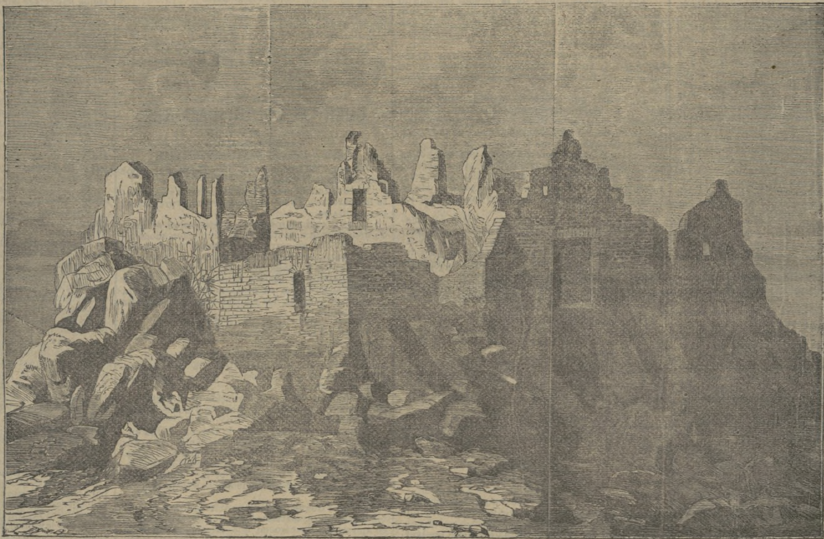
Ruinas del castillo de Montesa.

calidades, es hoy entre nosotros muy difícil, como lo son siempre las grandes obras llevadas á cabo por uno solo.