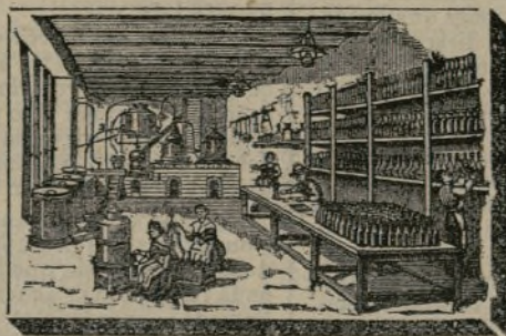
INTERIOR DE LA SALA DE ALAMBIQUES