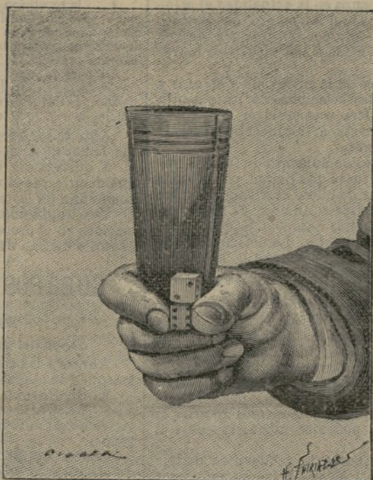
Experiencia de inercia.

Cuando se ha concluido esta operación, las lámi- nas de oro tendrán el grueso del más fino papel de