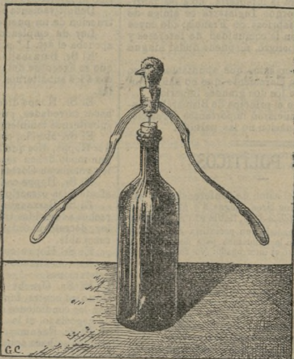
Experiencia de equilibrio.

cinco de grueso, como para que pueda entrar por la estrecha abertura que presentan los cilindros de ace- ro del laminador, cuya gran presión ejercida sobre el metal, caldeaado siempre hasta el rojo y á pequeños intervalos, va lentamente trasformando la barra en cinta que llega á alcanzar una longitud de quince metros del ancho primitivo y un grueso tan mínimo que sus bordes cortan como una hoja de acero aña- lada.