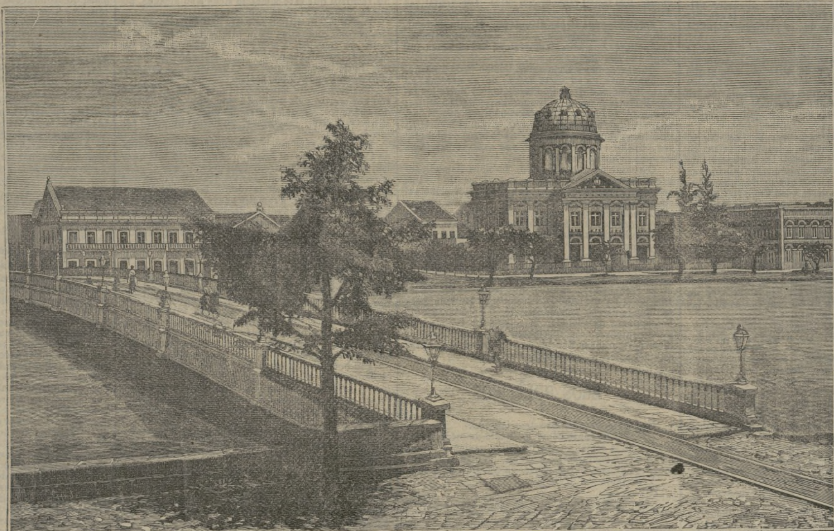
Vista de Pernambuco.

Se ha publicado el cuaderno 1.º, cuyo precio es 1 peseta.