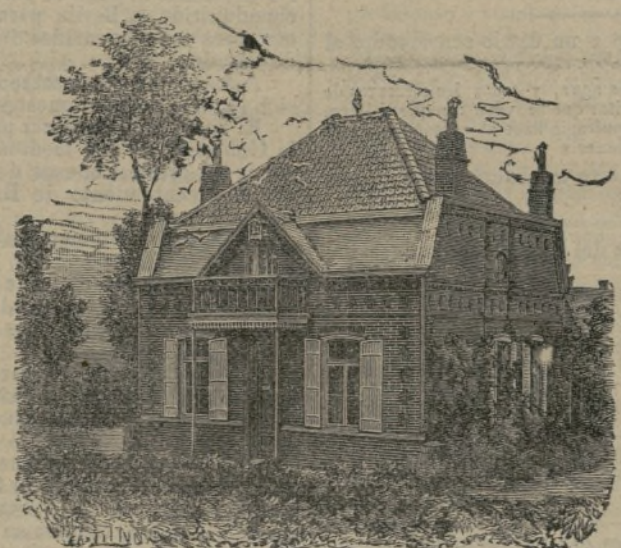
Las golondrinas mensajeras.