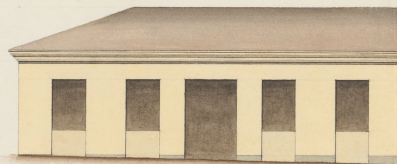
Fachada por la Calle de Escilla