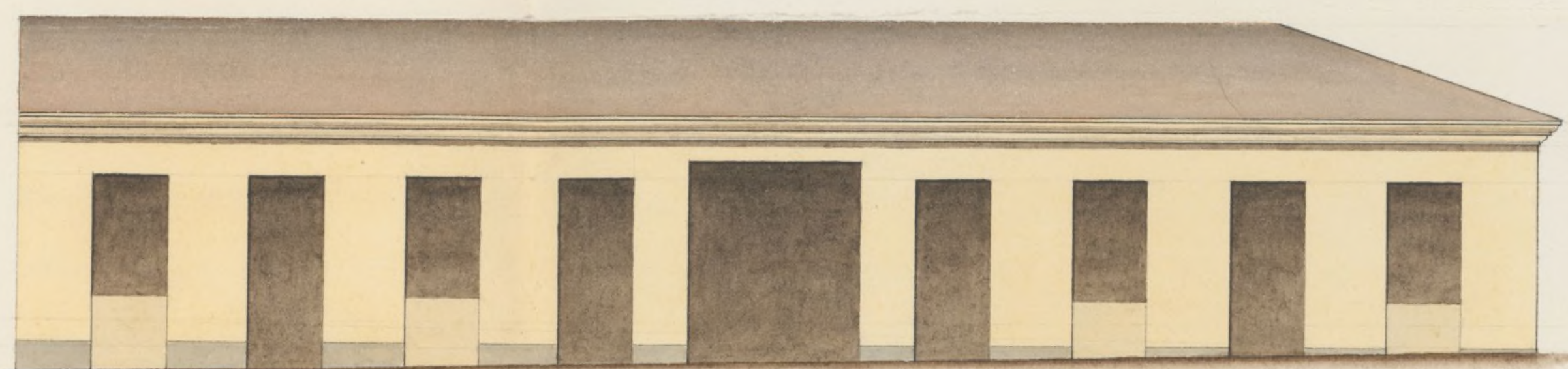
Fachada por la Calle de Martin de Vargas