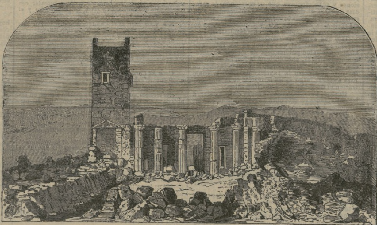
La Acropolis de Atenas.

Se ha calculado que el término medio de las defunciones del globo, sube a 67 por cada minuto, 97.790 cada día, y 35.639.825 cada año; y los nacimientos a 70 por cada minuto, 100.800 al día, y 36.792.000 cada año.