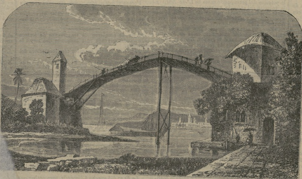
Uruguay.—El puente de Maldonado.

En 1888 en Francia un artículo poco estimado, y en 1892 el consumo total subió, para la población de 38.000.000 de habitantes, á poco más de un mil- lion de libras—hamayor, probablemente, la consumie- ron los ingleses, yankees y rusos.—El término me- dio por habitante fué de 13 1/2 gramos, esto es, me- nos de una onza. El uso del té disminuye en Fran- cia; en 1886 y 1887 fué de 14 1/2 gramos por per- sona. Al contrario, el consumo del café aumenta; desde 1841 ha cuadruplicado y doblado desde 1861. En 1866 subió á 136.000.000 de libras, y á 134.000.000 de libras, ó más de 3 libras y media por cabezas, en 1888.