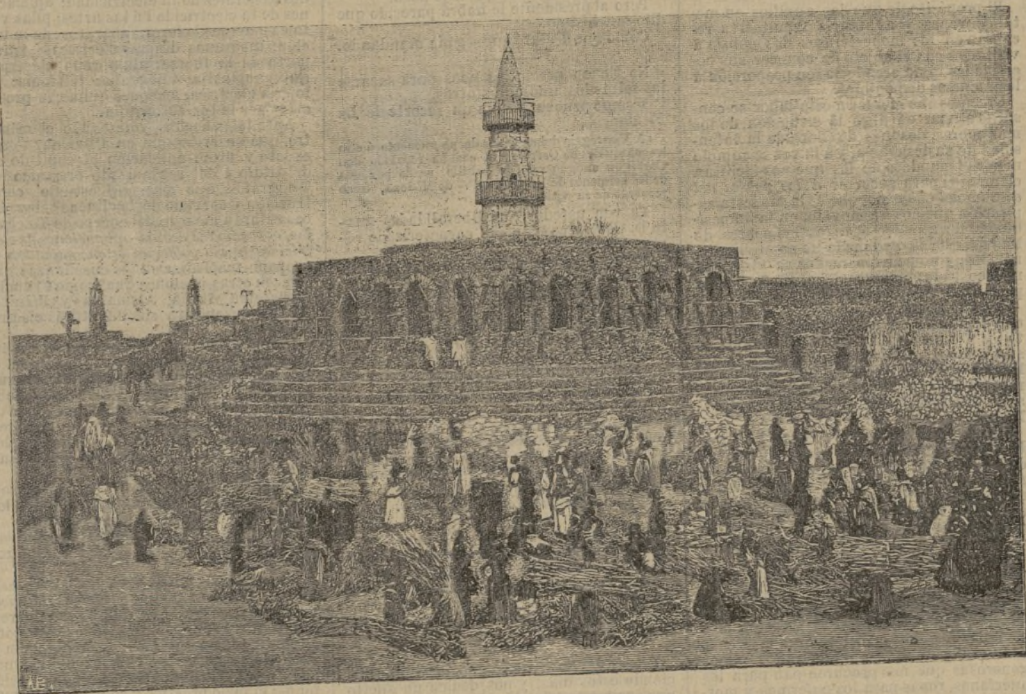
Nueva iglesia y la plaza del Mercado de Harrar.

Por lo tanto, el total de entradas del año actual excede del 87 por 100 de las alcanzadas en 1878.