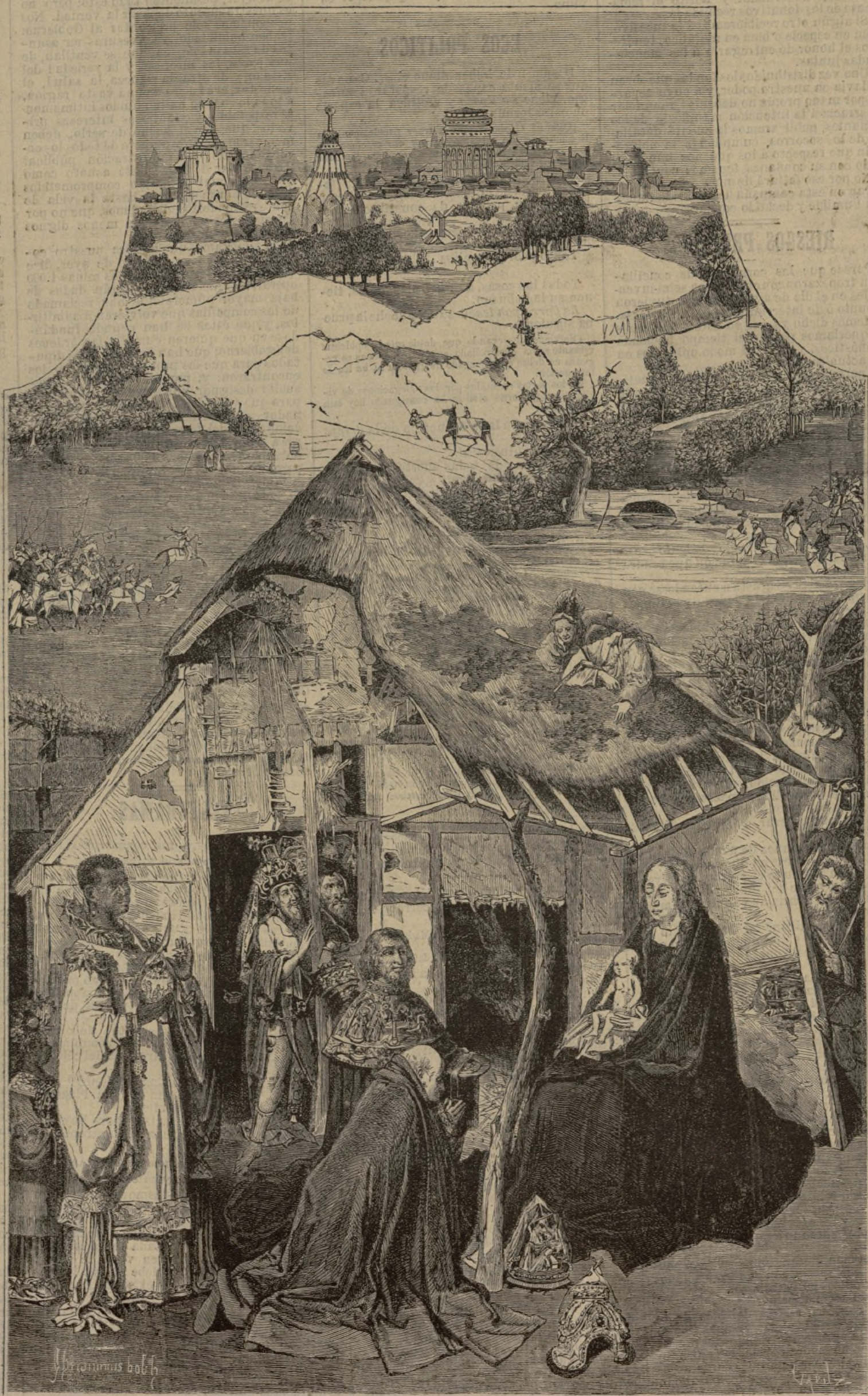
Adoración de los Reyes.

1840.—El general Serrano toma posesión de las islas Chafarinas. H. P.