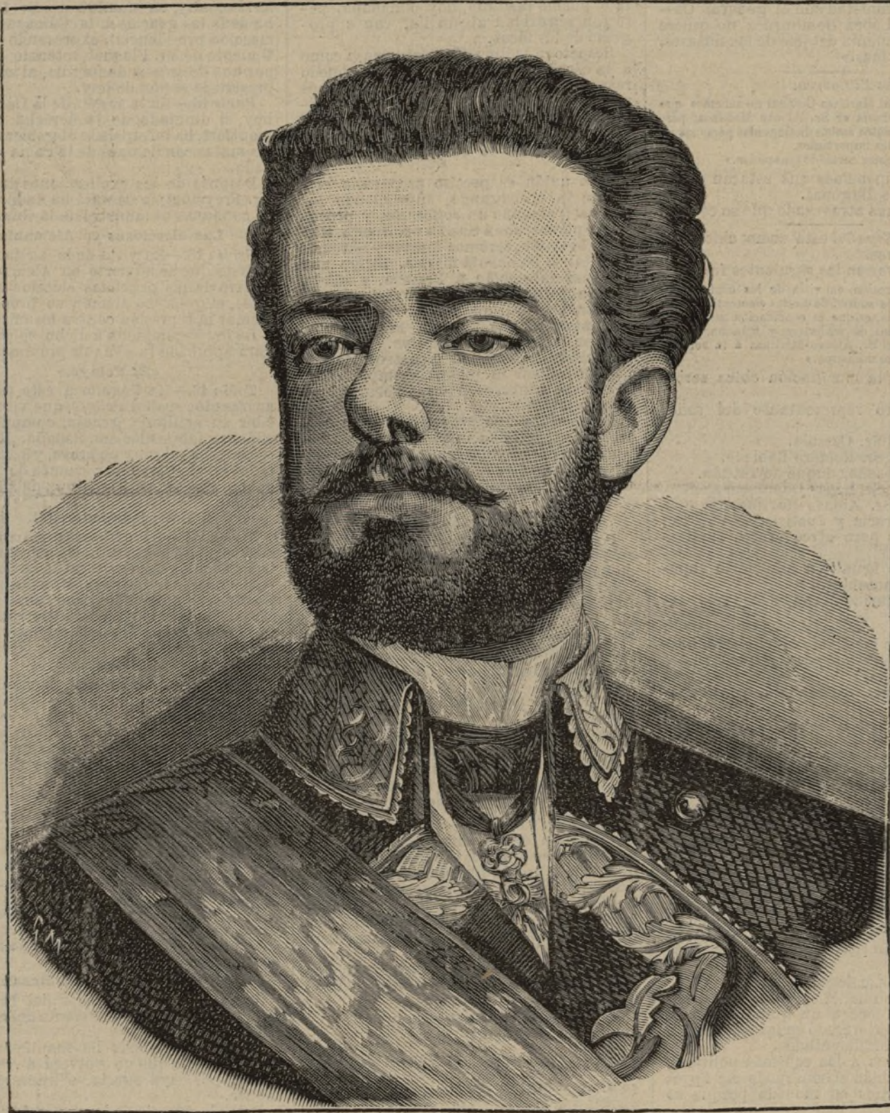
Don Amadeo de Saboya.

Entre la multitud de soberanos destronados que desde principios del siglo pa-