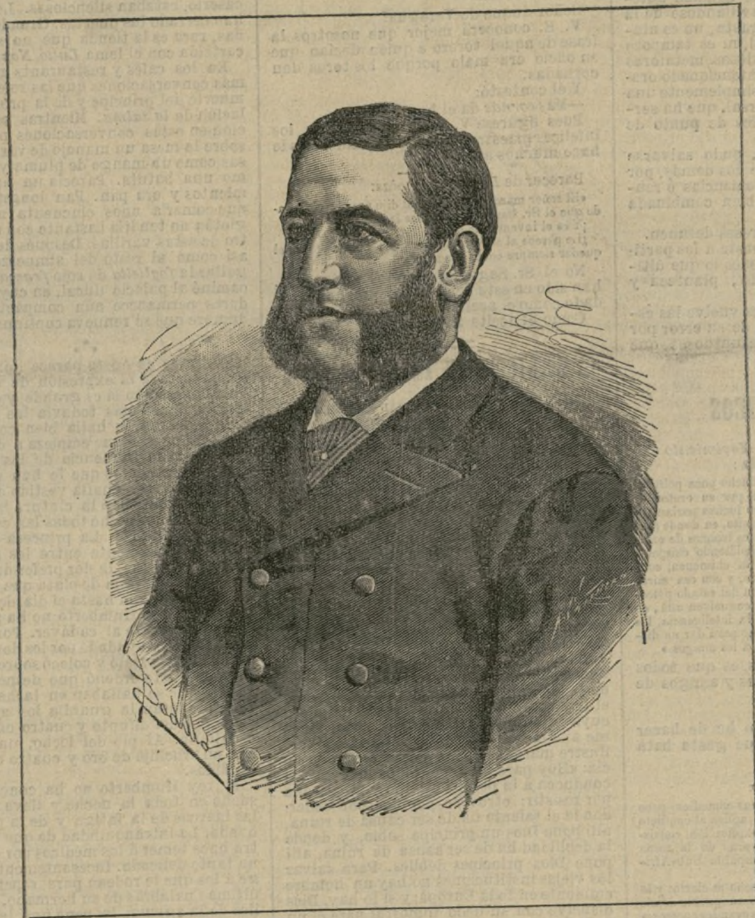
El duque de Veragua

Historia de las naciones.—Los Godos, por E. Bradley, versión española corregida.