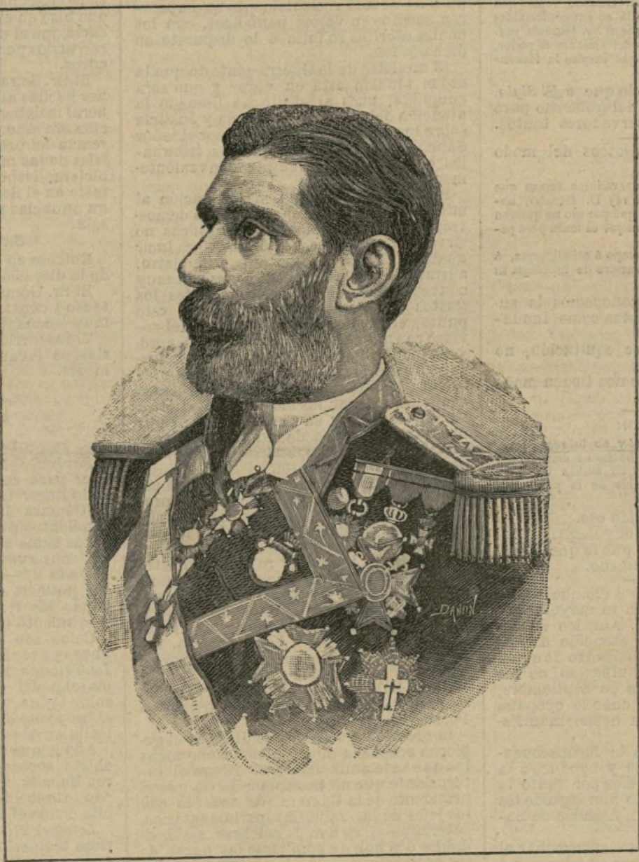
El contraalmirante Romero

No es posible vivir mucho tiempo juntos sin asemejarse. Todo contacto es un cambio. JULIA DAUDET.