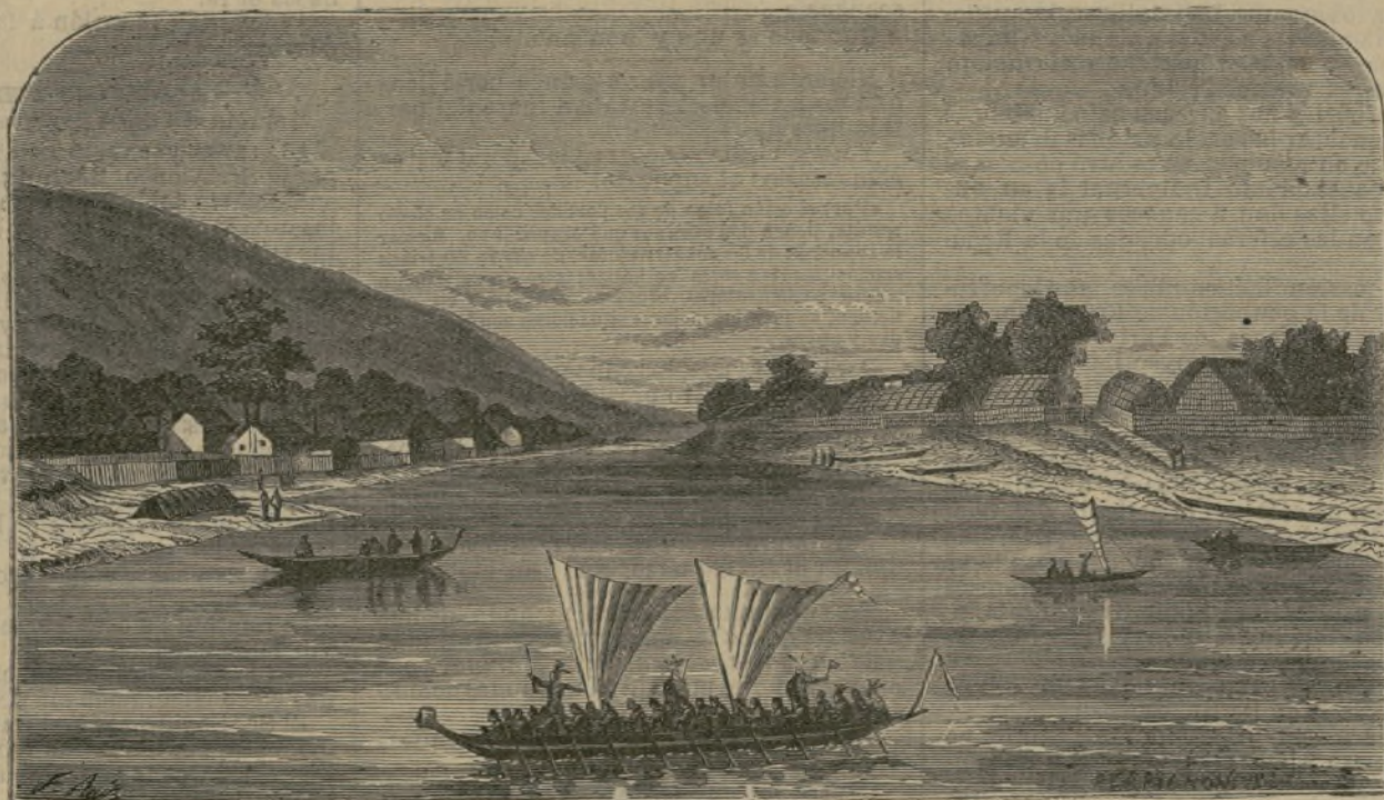
Aldeas fortificadas en Oceanía.

patentizan las diferentes opiniones que se han pronunciado sobre la antigüedad ó edad del mundo. Advertimos que de los cálculos siguientes es menester despejar las fracciones de mes, y añadir cuatro años a la Era vulgar, porque se ha demostrado ya por las disertaciones de los sabios de Europa que el nacimiento del Cristo es anterior en cuatro años a la época en que comúnmente se coloca; así el año 1890 es en realidad el 1804.