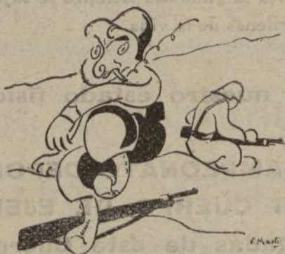
«Celipe», despreocupado, ni su fusil ha limpiado.