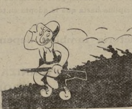
Y en el ataque iniciado, maldice el tiempo gastado.