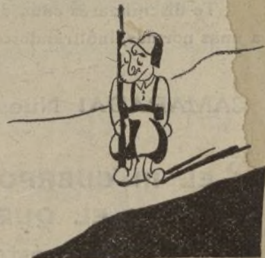
El sargento se ha enterado y hacer guardia le ha obligado.