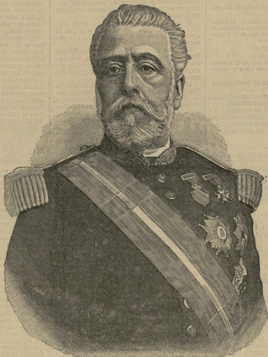
El general Bermúdez Reina.

del ministerio. Enumerar todos los servicios distinguidos prestados en tan espinoso cargo sería tarea prolija; el gobierno, para premiar al Sr. Bermúdez, le ascendió a brigadier en 21 de Noviembre de 1873 con gran aplauso del país y del ejército.