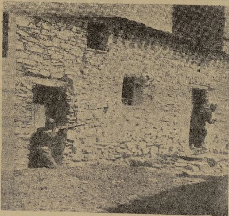
EN EL FRENTE DE EXTREMADURA Entrada de nuestros bravos milicianos en el pueblo de Valdelacasa.

La colonia española en Shanghai ha formulado una denuncia ante el vicecónsul Larracochea, contra la actitud completamente desleal para el Gobierno de Madrid que ha adoptado el cónsul general, señor Vázquez Ferrer. El vicecónsul ha trasladado la protesta a Madrid.