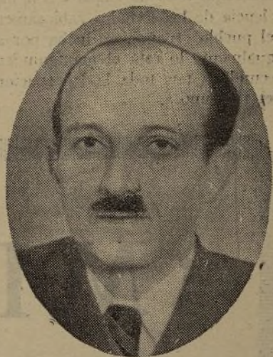
El primer embajador de la U. R. S. S. en España, camarada Marcel Rosenberg, que ayer presentó sus credenciales al Presidente de la República.

Y los traidores tienen que reclutar pistola en mano.