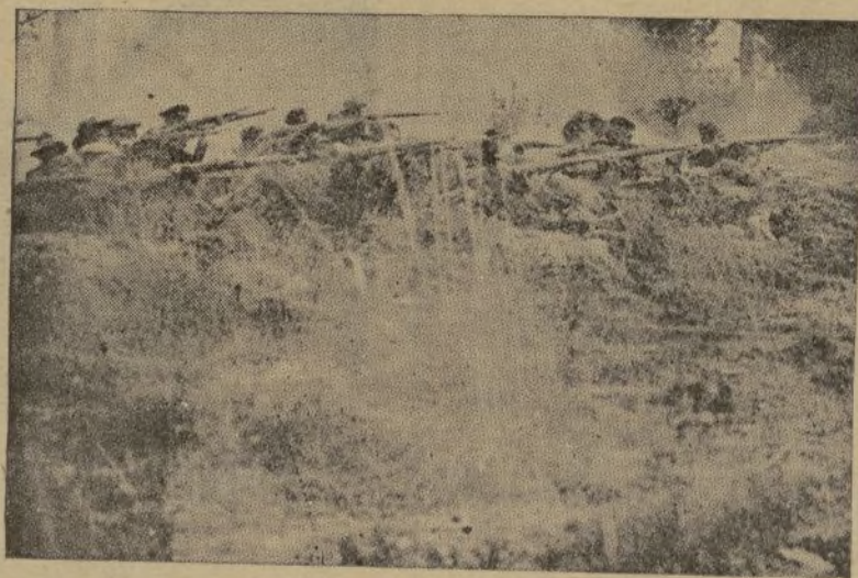
Una avanzadilla de nuestras fuerzas batiendo las posiciones enemigas.

Un periodista preguntó al señor Hernández si la visita del presidente del Tribunal Popular, que salió de la Presidencia a la terminación del Consejo, estaba relacionada con la pena de muerte dictada contra Salazar Alonso, y el ministro de Instrucción Pública contestó afirmativamente.