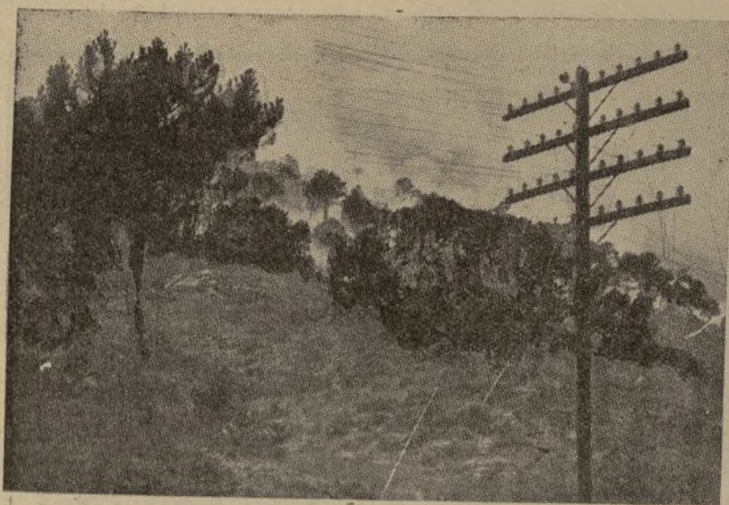
Efectos del bombardeo de nuestras baterías, sobre las avanzadillas enemigas

(Del Consejo Nacional de Juventudes de Izquierda Republicana.)