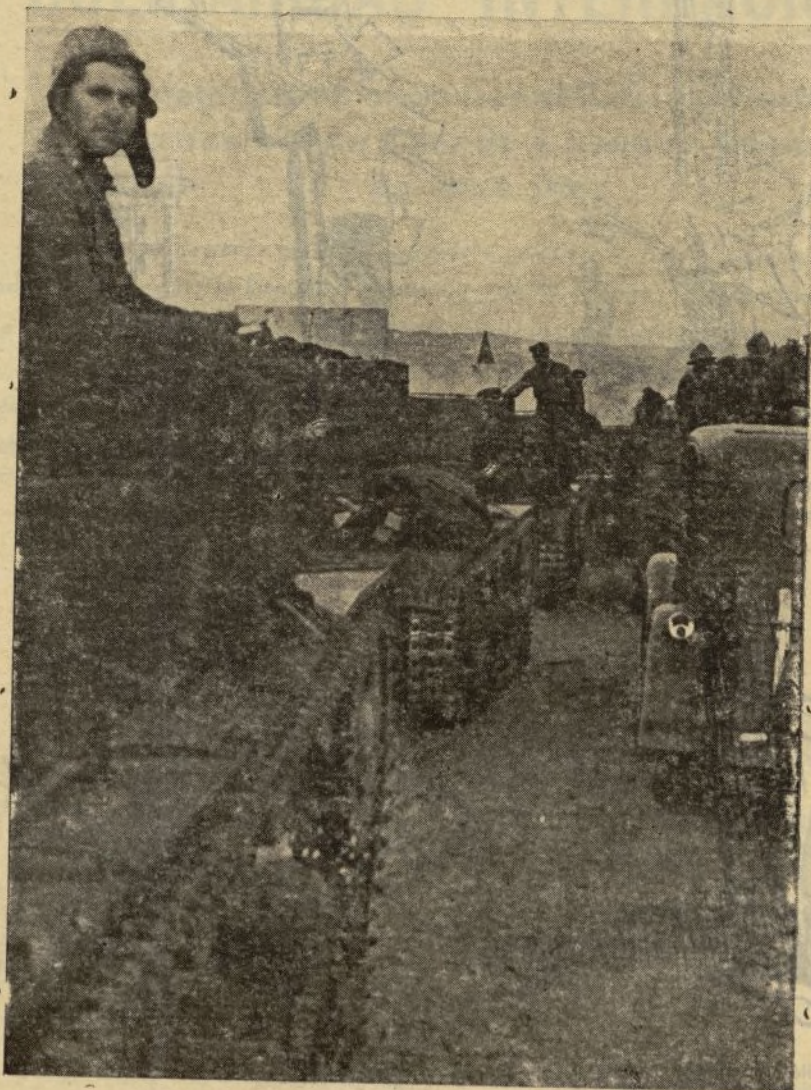
De la potencia de nuestro armamento son buena prueba estos tanques