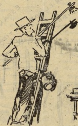
De pronto, cuando más alto estaba en las escaleras...

Nos comprometemos a consagrar todavía mayor energía para aumentar la ayuda moral, material y financiera a vuestra buena causa, que es el símbolo de la esperanza para todos los pueblos amigos de la paz». — A. I. M. A.