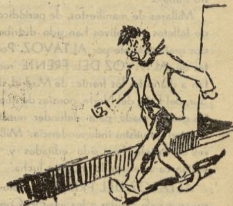
...vió venir por la calle a un loco suelto que vivía en su misma casa. Y tembló.