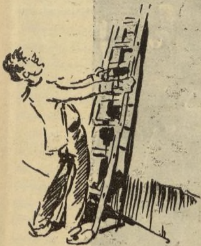
—¡Oselito!—gritó el loco, zamarreándole trágicamente el pedestal! —¡Agárrate a la escobilla, que te voy a quitar la escalera!