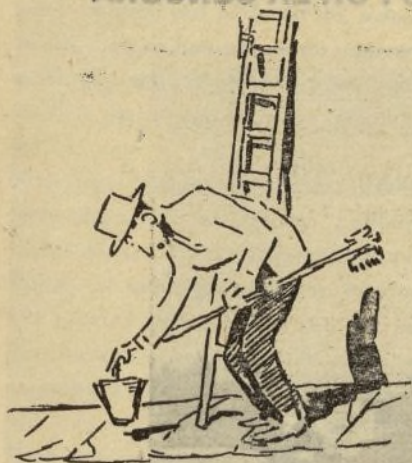
Oselito empalmó las escaleras, arregló el cubo de cal, limpió su escobilla y...