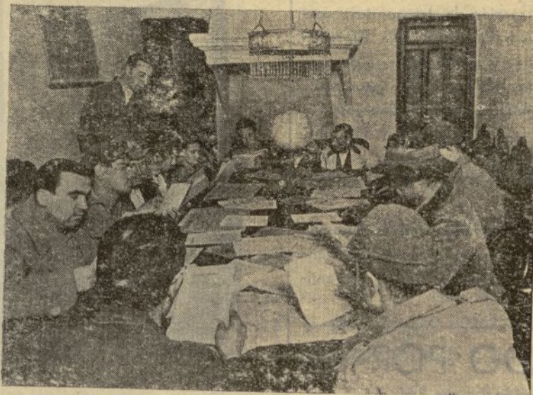
A la Biblioteca concurren campesinos y soldados