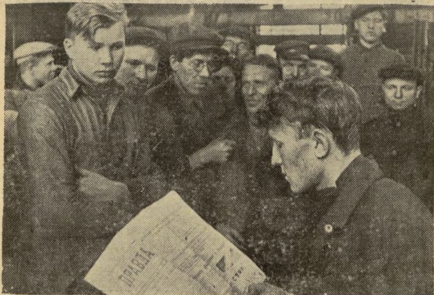
Obreros de una fábrica de Leningrado siguen con interés la marcha de la guerra en España