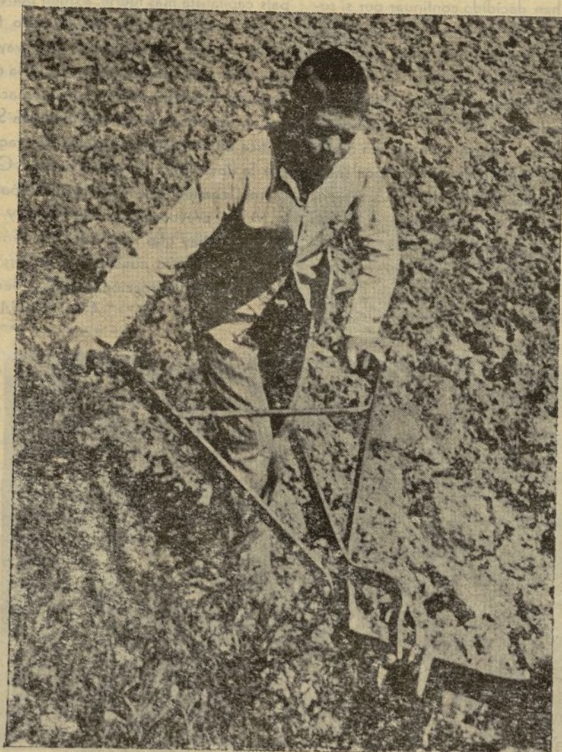
Empuñando el arado mientras sus hermanos mayores empuñan el fusil

¡Vivan los campesinos que trabajan día y noche para recoger la cosecha!