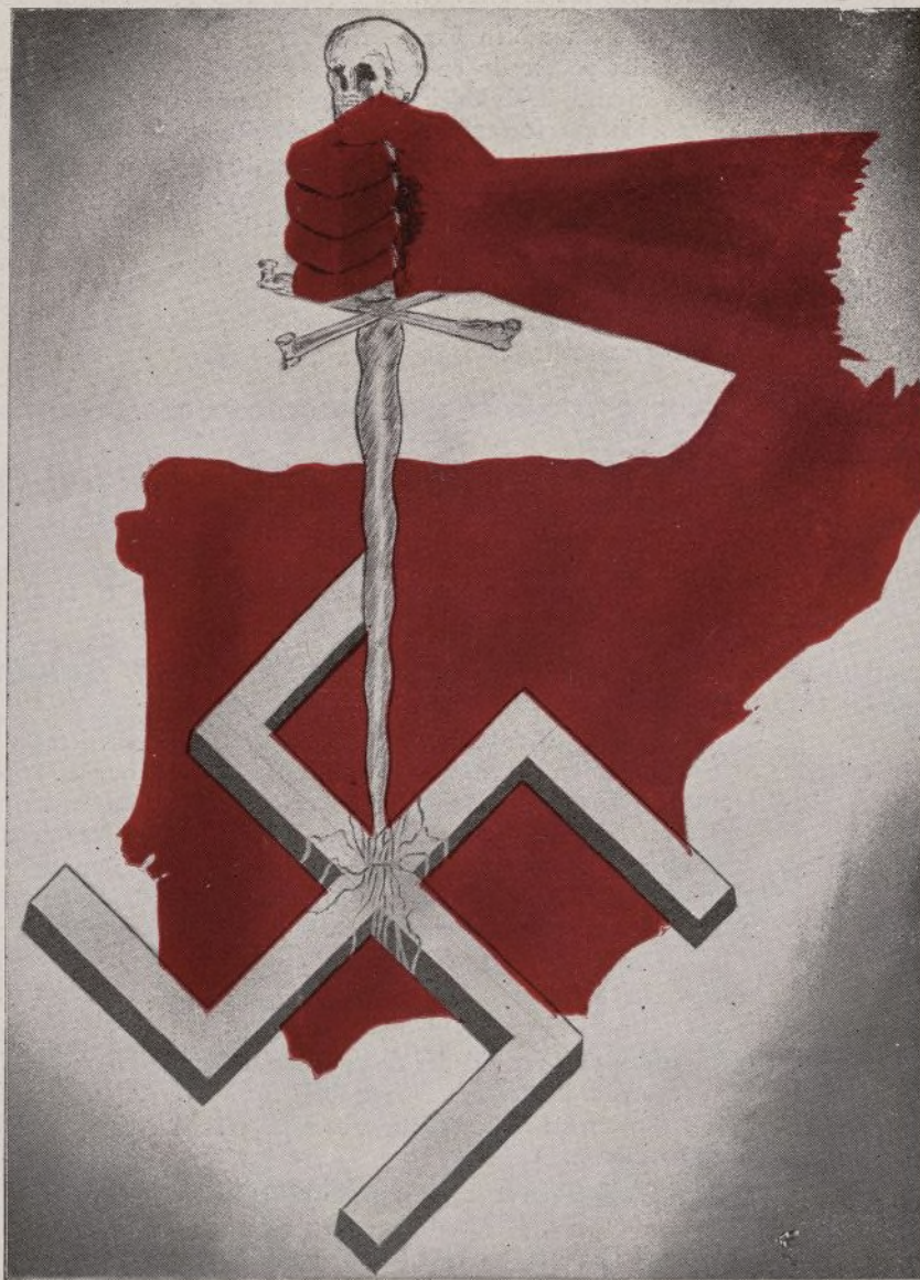
Dibujo de Emilio.

Hidalguía y nobleza se engarzan en los corazones de