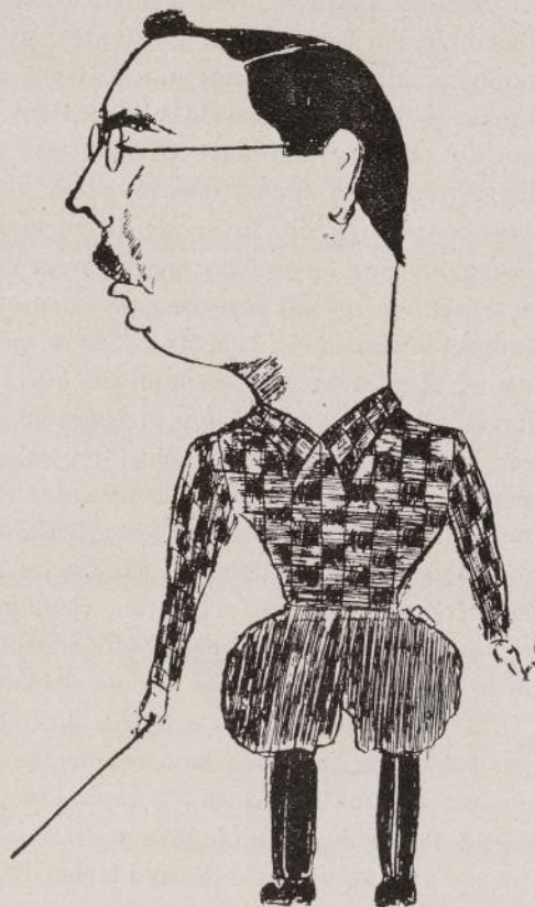
Comandante Fernández Llabayol