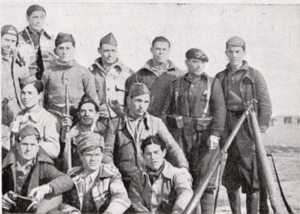
Grupo de choque, perteneciente a uno de nuestros cuerpos de Ejército.