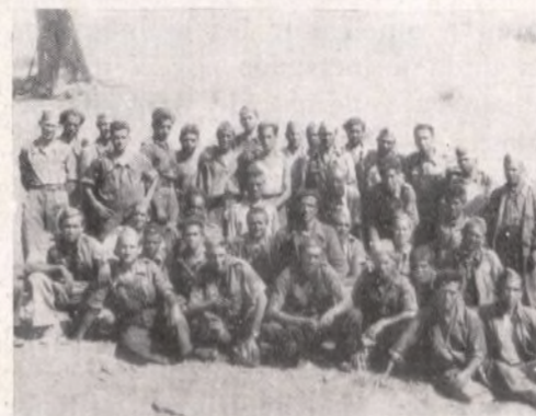
Militares, muralla que contiene al fascismo y arietes que romperán las puertas de las fortalezas de la traición.

¿Cosas destacables de esta ofensiva? Sí las hay dentro de la Compañía. Dos escuadras rompieron las alambradas, cogiendo a un sargento pri-