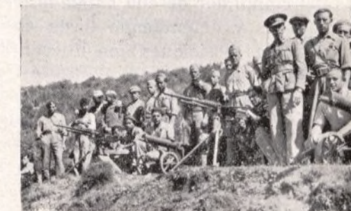
Grupos de camaradas que resisten y avanzan.

Con gran serenidad e indecible dosis de valentía se comportaron los camaradas de esta escuadra, que está