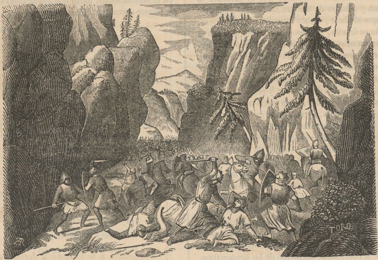
Batalla de Roncesvalles.

Mala la hubistes, franceses en esa de Roncesvalles.