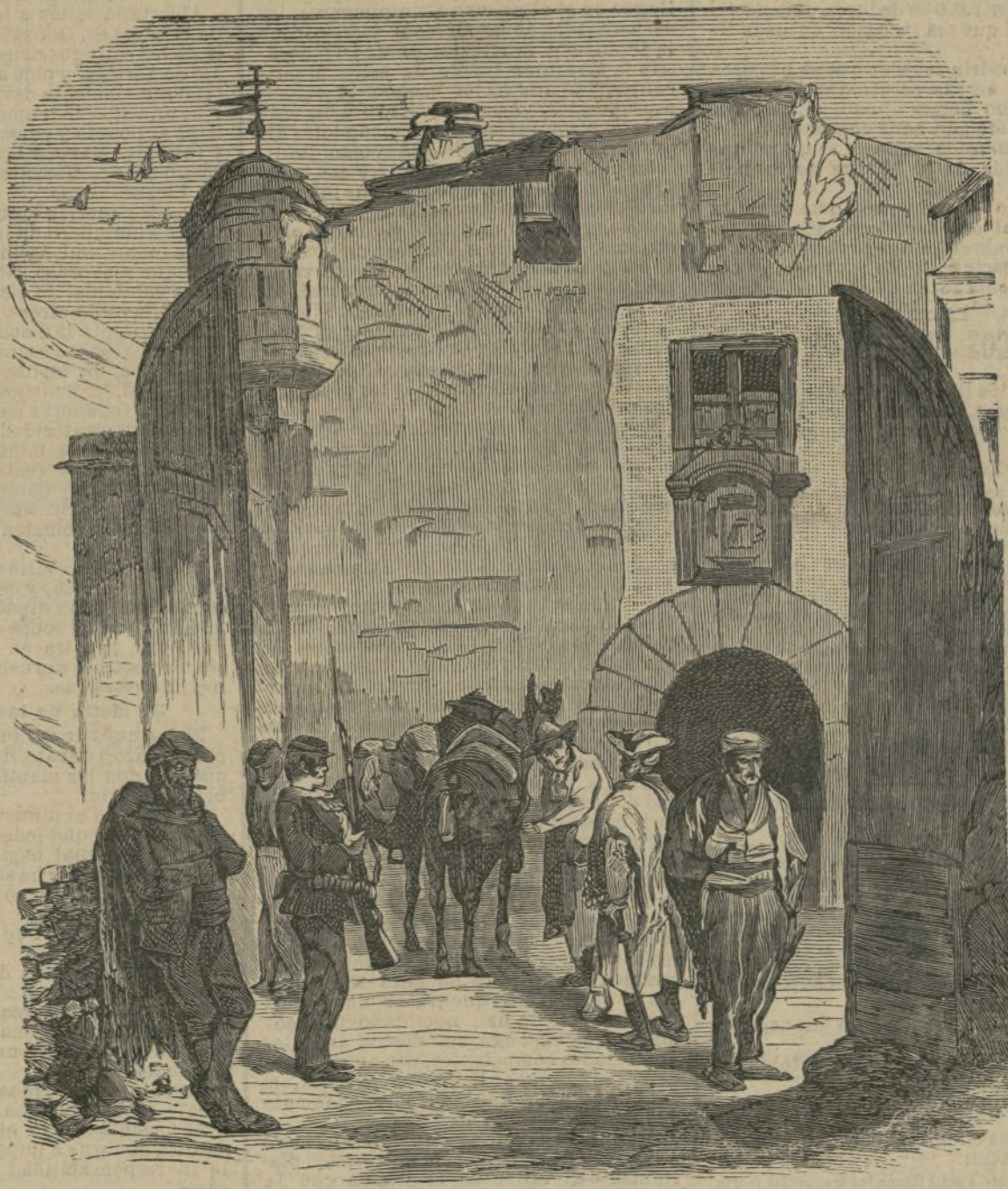
ANDORRA.—Palacio del Consejo.