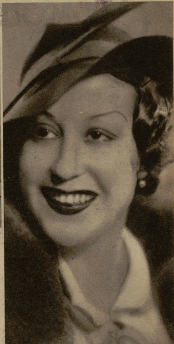
La bella y notable tiple Flora Rubio, una de las figuras más destacadas de la compañía que actúa en el Ideal Rosales