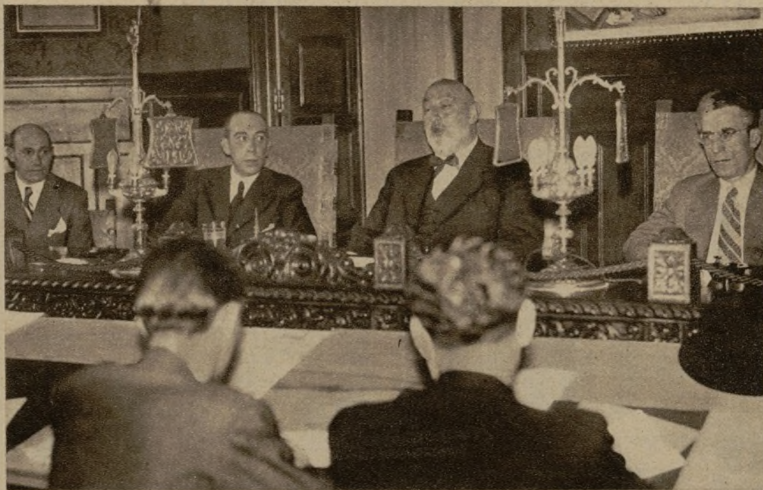
El ilustre jurisconsulto don Angel Ossorio Gallardo durante la notabilísima conferencia que dió ayer en la Escuela de Policía sobre el tema "El sentido de la autoridad"