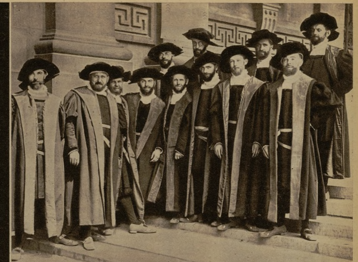
El Colegio de regidores que figuró en el cortejo

Vista parcial de la Gran Plaza de Bruselas, por la que desfiló el cortejo del emperador Carlos V. Al fondo, la Casa del Rey, delante de la cual fué ejecutado, por orden del duque de Alba, el patriota belga conde d'Egmont