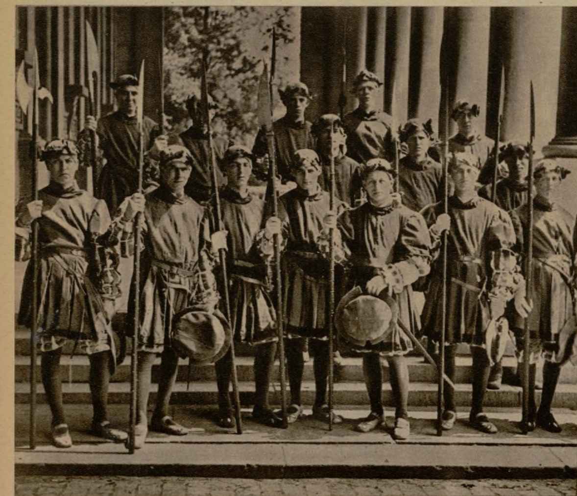
La escolta del emperador. Ropillas de terciopelo, gregüescos, sombreros y gorras con plumas, lanzas y arcabuces...

Los gigantones del cortejo que evoca la visita a Bruselas de Carlos V, en el año 1549, en su desfile por las calles de Bruselas