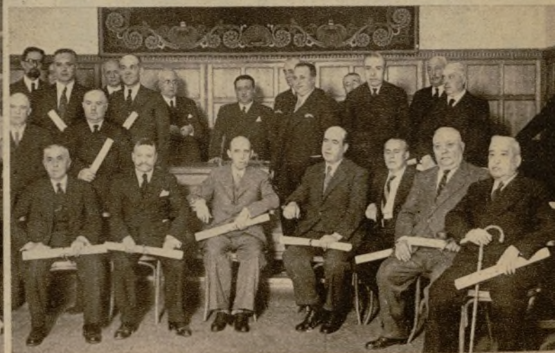
Dependientes mercantiles, a los que la Cámara Oficial del Comercio ha concedido premios por su laboriosidad y constancia en el trabajo