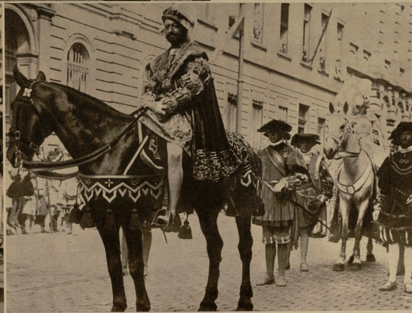
Carlos I de España y V de Alemania, a su paso por las calles de Bruselas el 9 de junio de 1935

Y el encanto de ese mediodía de junio de 1935, en que tuve el honor de encontrarme con Carlos V en las calles de Bruselas, se rompe por culpa de "Faire attention" de un lancero del emperador.