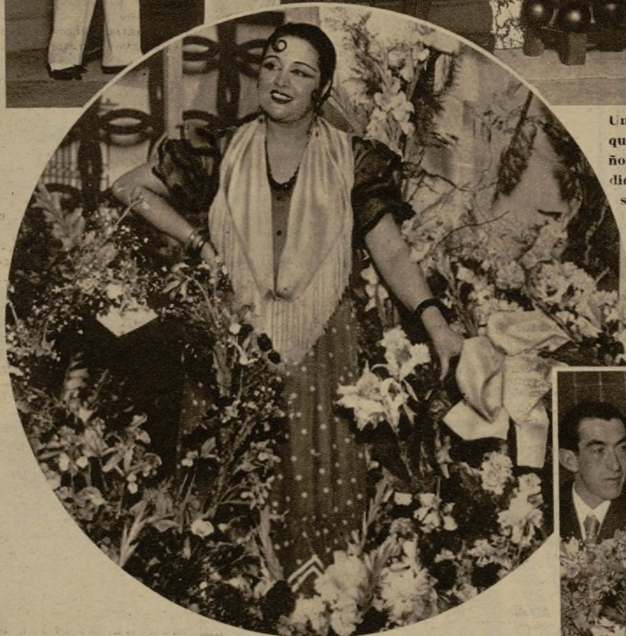
La gran actriz Carmen Díaz después de su función de beneficio, que constituyó un gran homenaje admirativo para la ilustre artista