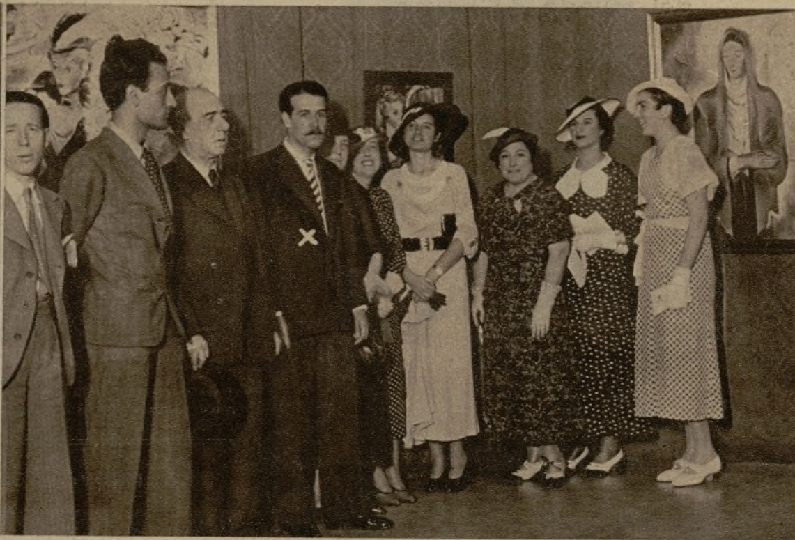
Un grupo de concurrentes al acto inaugural de la notable Exposición del laureado pintor José Luis Florit (x), en los salones del Museo de Arte Moderno