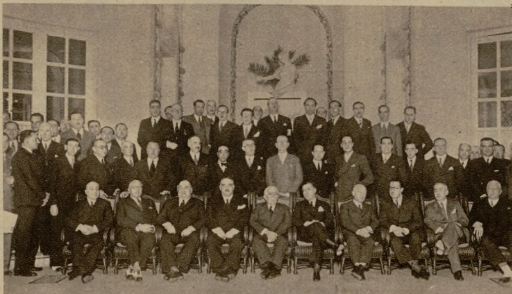
Grupo de concurrentes al banquete que los abogados del Estado han tributado a su compañero señor Salmón, con motivo de su nombramiento de ministro de Trabajo