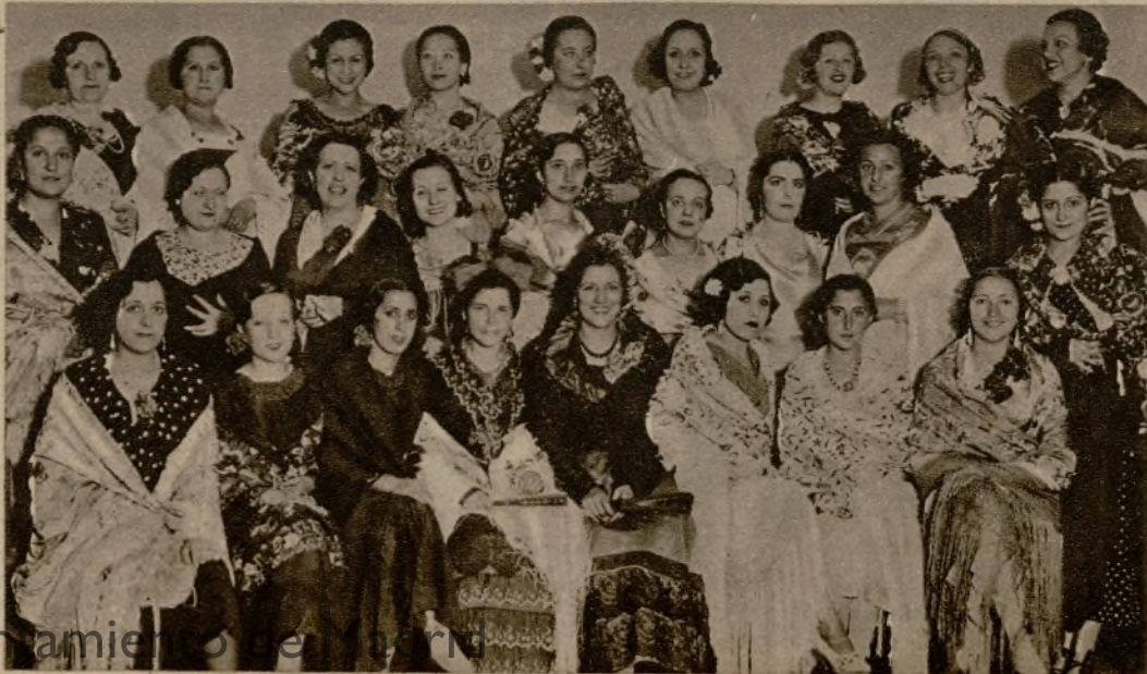
Bellas señoritas que concurrieron a una típica "Fiesta del Mantón", organizada por el Montepío Comercial e Industrial madrileño