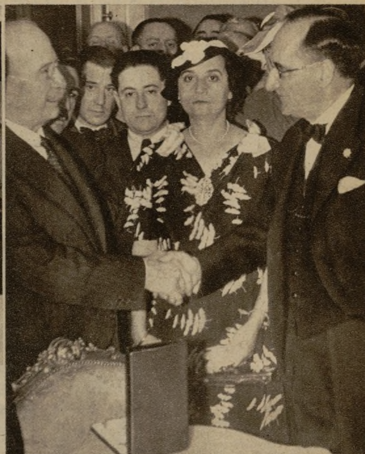
El jefe del Gobierno felicitando al ilustre doctor Verdes Montenegro, después de imponerle la placa de la Orden de la República en el homenaje al insigne médico, celebrado en los salones de la Presidencia del Consejo