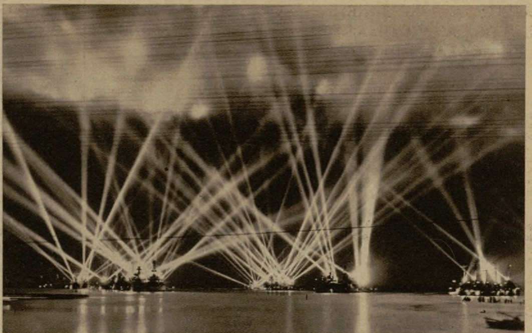
Un fantástico momento de las maniobras nocturnas de la escuadra norteamericana, en Pearl Harbour (Honolulu). Trescientos cincuenta potentísimos reflectores iluminan el cielo