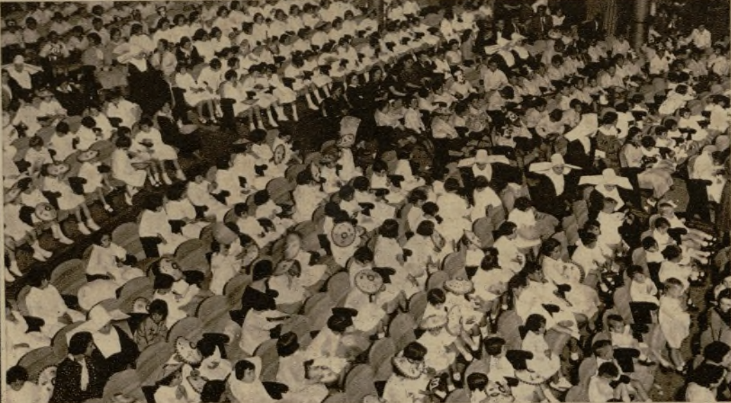
Unión Radio, para celebrar el décimo aniversario de su inauguración, tuvo ayer el generoso rasgo de obsequiar con una bella fiesta, en el Monumental Cinema, a los niños de los Asilos de Madrid, a los que, además, obsequió con meriendas y juguetes. Los alborozados pequeños durante el lucidísimo festejo