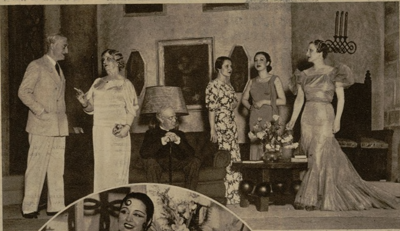
Una escena de la obra "La mujer que se vendió", original de los señores Navarro y Torrado, los aplaudidísimos autores de "La Papirosa", estrenada con halagüeño éxito en el teatro Victoria