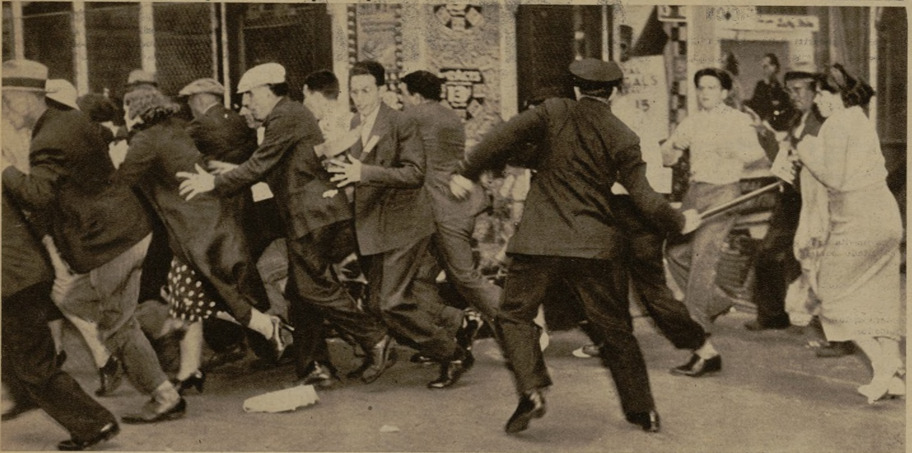
En una manifestación de obreros sin trabajo, en Nueva York, los grupos se manifestaron tumultuariamente, teniendo que intervenir la Policía con la contundencia que se aprecia en la foto