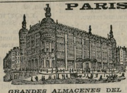
GRANDES ALMACENES DEL

AL PÚBLICO.—Esta casa es la más anti- gua de su clase, la que cuenta con mayores ele- mentos y la que realiza operaciones de gran importancia, porque además de un respetable capital propio, cuenta con la poderosa ayuda de veinte capitalistas de Madrid que operan en la casa desde el año 1884, y se ruega muy en- carecidamente al público no confunda esta casa con las nuevas que aparecen diariamente parodiando nuestros anuncios.