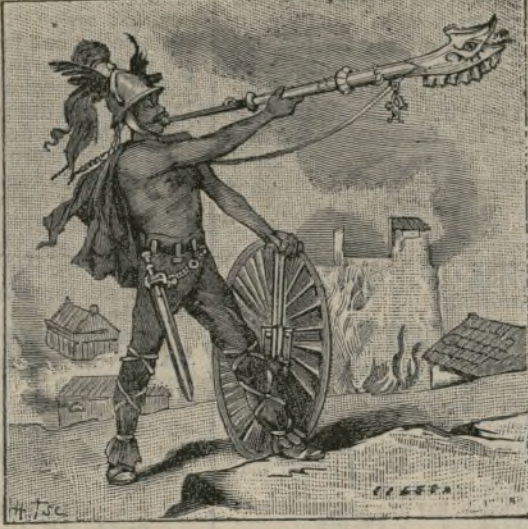
Los primeros músicos militares.

Era aquella la vez primera que Antonio se asomaba a la ventana y fijaba su atención en el jardín.