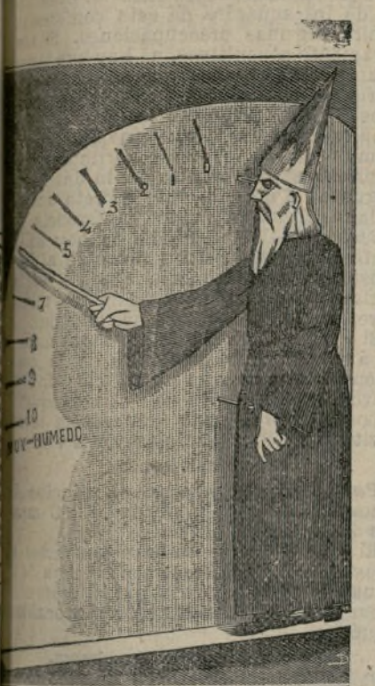
Construcción de un higrómetro.

Se dibuja sobre cartulina una figura del tipo que se desea, y después de recortarla se fija frente a otro cartón con alfileres, en la forma que indica el grabado.