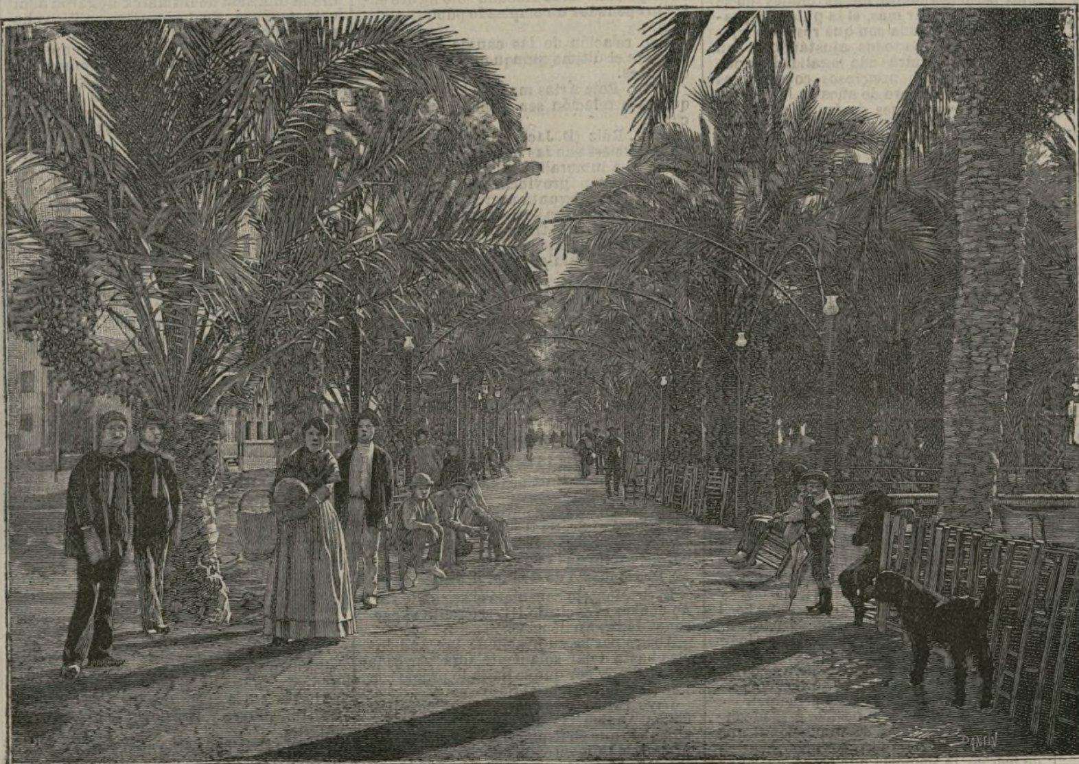
El paseo de los Mártires en Alicante.

gobiernos, Diputaciones y Ayuntamientos harían algo por aprovechar ciertos dones que la Naturaleza nos concede. Varios pueblos de nuestro litoral del Mediterráneo y de Levante podrían ser albergue, durante los crudos días de invierno, para algunos de los muchos extranjeros que buscan en Niza, San Remo y Grasse lo que encontrarían mejor en Alicante, Málaga y Almería; y muchos enfermos del interior de España que encuentran muerte segura en los rigores de un clima desigual y riguroso, alargarían los días de su vida sólo con pasar en estas capitales, los crudos días de invierno. Pero nosotros somos así: indolentes, apáticos y dejando a la Naturaleza toda la labor de mejorar nuestra raza y nuestro suelo.