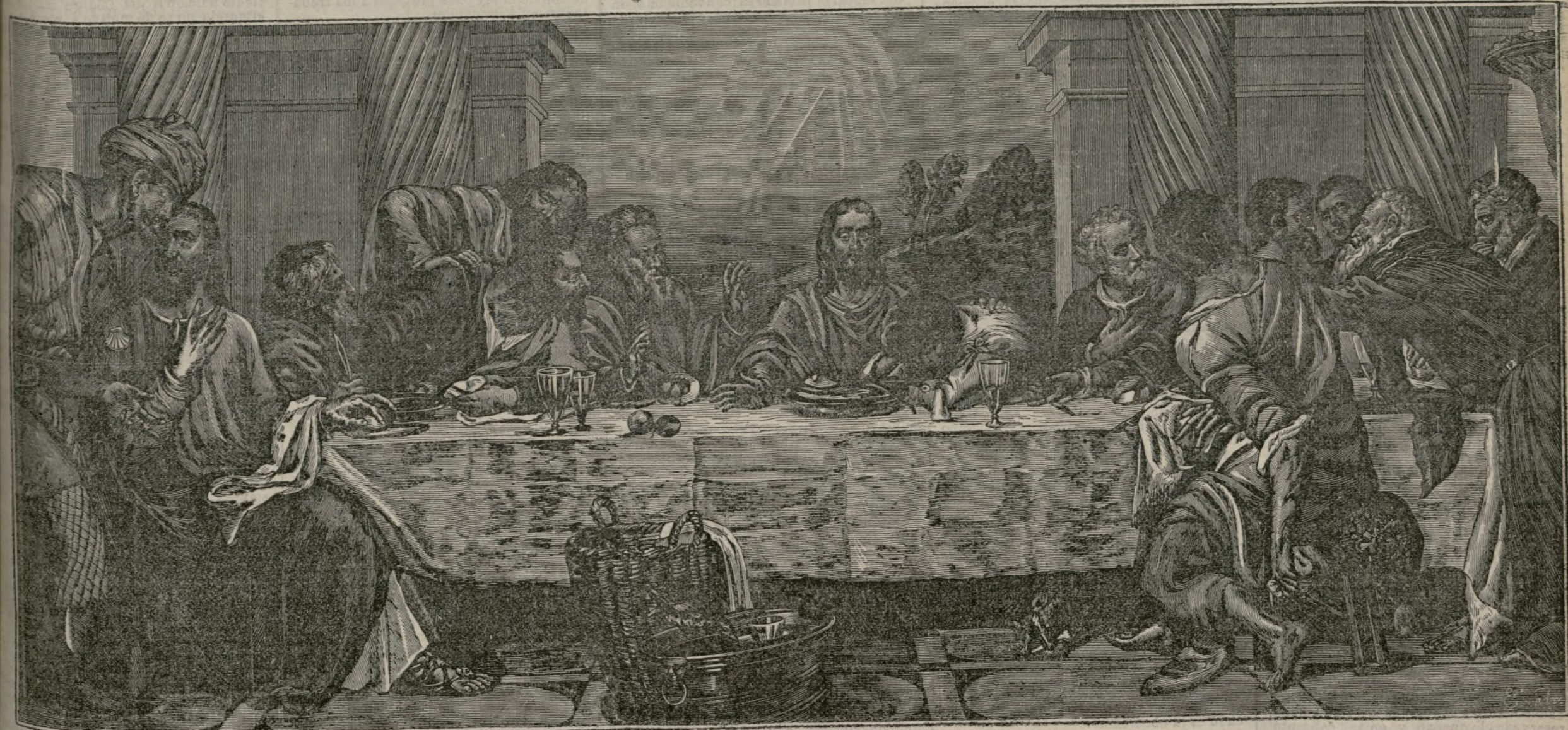
La cena del Señor.

El retablo mayor es de los que en España deben considerarse como de más trabajo y primor en la escultura y por lo más sobresaliente que aquí se ejecutaba a principios del siglo XVI. Es notabilísimo el se-