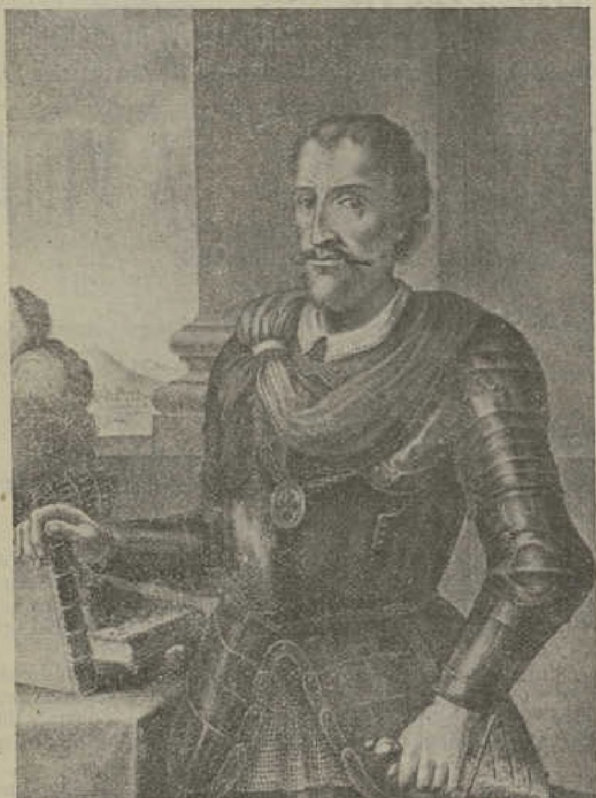
Hurtado de Mendoza.

Sociedad de Ediciones LOUIS-MICHAUD, bou