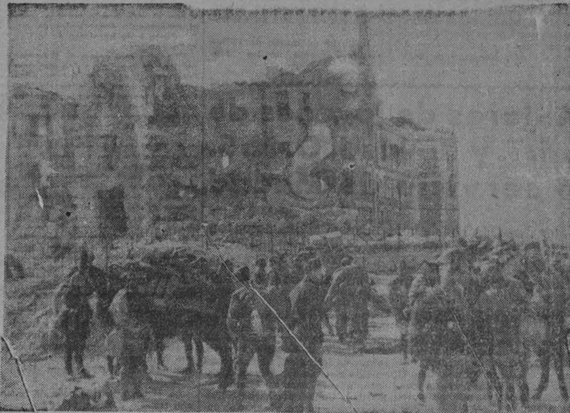
Las tropas nacionales, al abandonar el Clínico, camino de Madrid.

Madrid, 30 de marzo. Tercer Año Triunfal.—El de Guerra del Ejército de