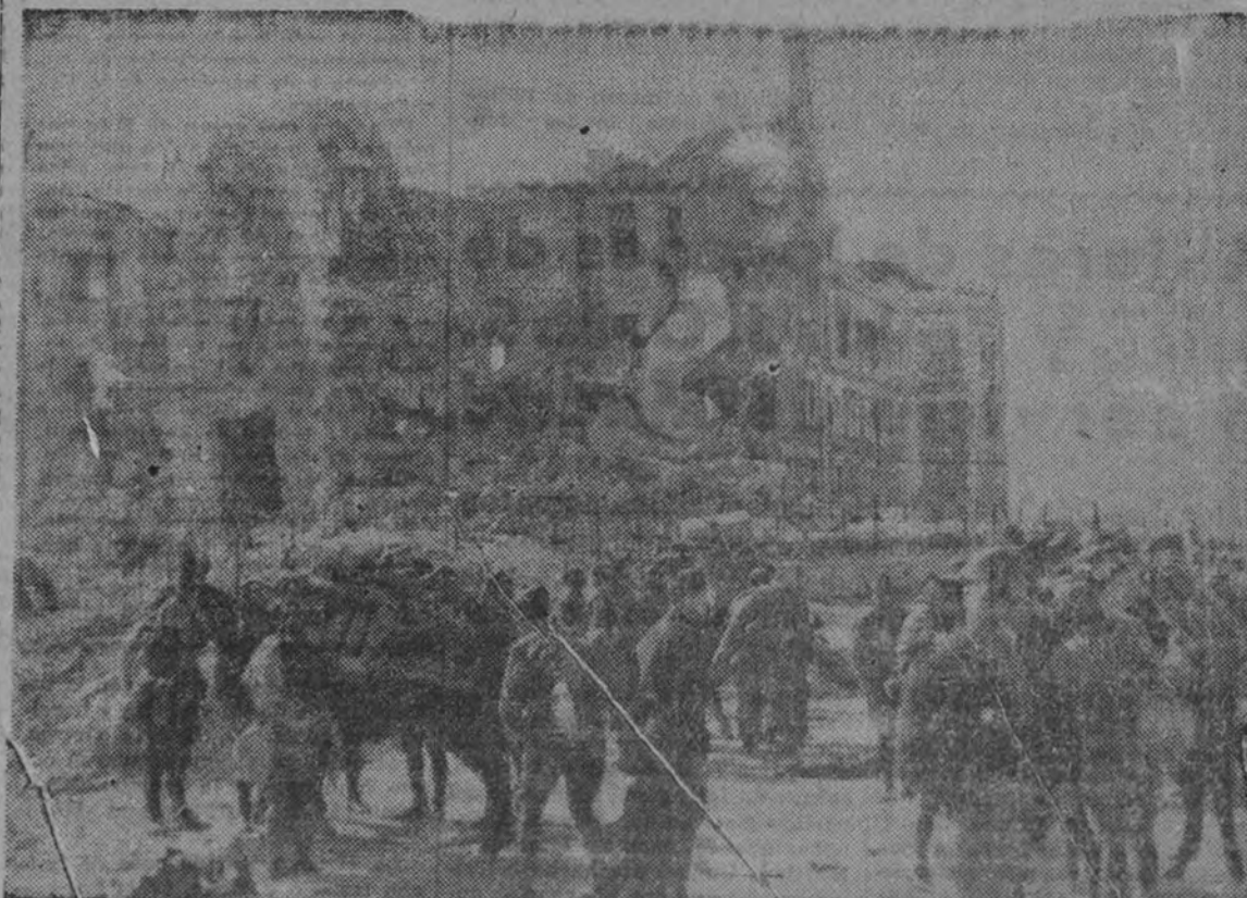
Las tropas nacionales, al abandonar el Clínico, camino de Madrid.

DO: DE MAYO.—De 3 a 5, Los cuatro hermanitos (Katharine Hepburn).