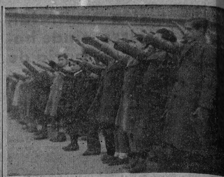
De aquel edificio de la calle del Marqués del Riscal, donde la Falange comenzó a vivir con su ardor combativo, saben ahora estos niños, que juran ya, brazo en alto, ser la firme garantía de la nueva España.