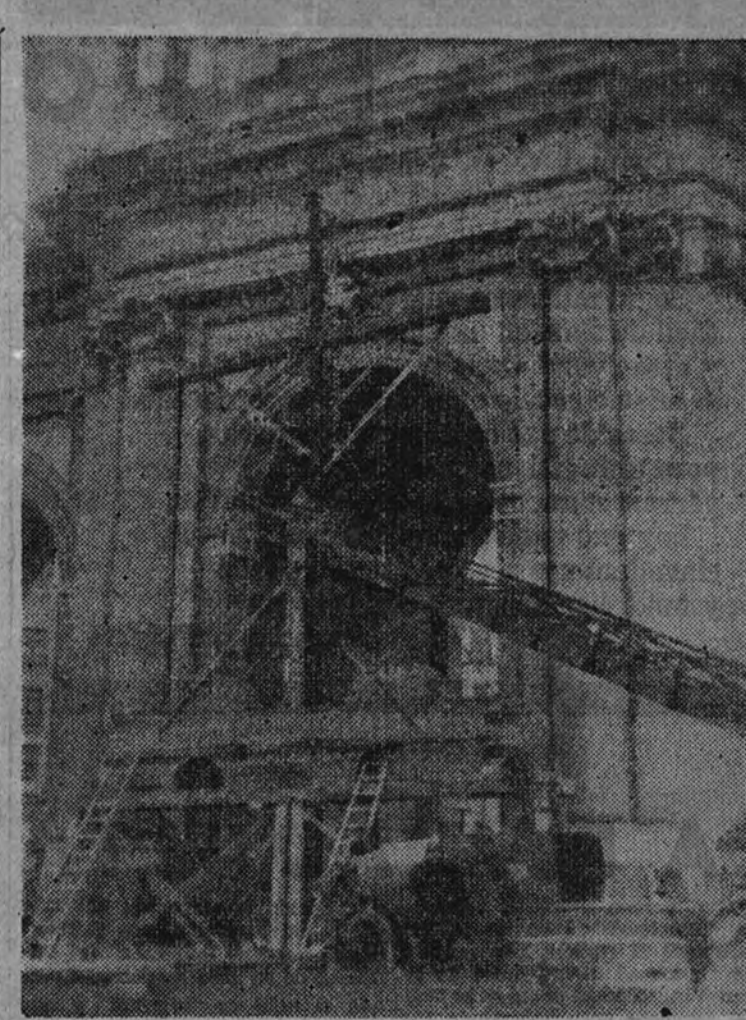
En la puerta de Alcalá va tomando forma el altar para la gran misa de campaña.

El ejemplo de la vida privada, las enseñanzas de tus doctrinas y la ejemplaridad de tu muerte. Hoy, que estás gozando de Dios, pídele por los que aún estamos luchando en la tierra por tus mismas ideas; pídele para que nuestra España sea la España por ti soñada.