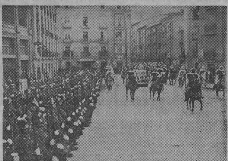
Soldados de España presentan armas al Generalísimo, que, rodeado de su escolta, se dirige al edificio de Capitanía para recibir las cartas credenciales del embajador de Inglaterra.

El discurso del embajador contestó S. E. el Jefe del Estado con la siguiente alocución: "Señor embajador: Al recibir las cartas credenciales que os acreditan como embajador de S. M. británica, me complace el escuchar la simpatía que a vuestra nación han merecido los heroicos sacrificios de nuestro pueblo, así como el deseo que me expresáis de estrechar las relaciones entre nuestros países. La nueva España que vais a conocer surge, llena de vitalidad y fortaleza, después de haber prestado al mundo el gran servicio de batir en su solar la potencia destructora del internacionalismo bolchevique, salvando una fe y una civilización gravemente amenazada; por ello, al asomarse de nuevo al mundo, consciente de su responsabilidad histórica, y al reanudar sus relaciones con los países a los cuales, como con el vuestro, ocurre, se halla ligada por viejos lazos de amistad, basada en imperativos geográficos, lo hace segura de encontrar un reconocimiento a sus grandes sacrificios y la más leal correspondencia a sus nuevos propósitos. En este espíritu habréis de encontrar en mí y en mi Gobierno la más noble de las colaboraciones."