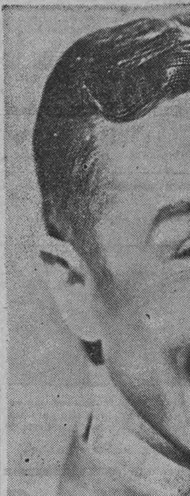
JOE E. BROWN

"Charlie Chan, en la Opera"—Estrenado en el Palacio de la Música, este nuevo episodio del ta-