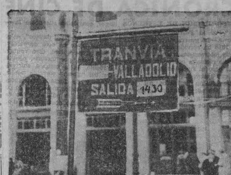
¡Qué emoción contemplar esa tabilla, que tanto dice de cómo se normaliza día a día la vida madrileña! Pero ¿qué hubiéramos experimentado si la vemos durante el período maravilloso que se abre en agujas y a punto de partir?