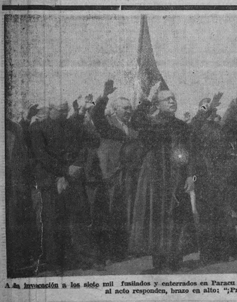
A la invocación a los siete mil fusilados y enterrados en Paracuellos del Jarama, los asistentes al acto responden, brazo en alto: "¡Presentes!"

Chamberlain, el hombre que a los setenta años lleva su política en avión, y que hoy tiene ante sí el recuerdo de la experiencia de Eden.