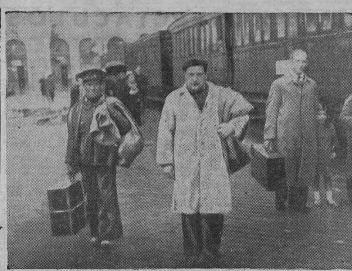
"Señores viajeros, al tren..." V edios, con sus equipajes, dispuestos a tomar el primer tren que salió de la estación del Norte

Madrid, 11 de abril de 1939.—Año de la Victoria.