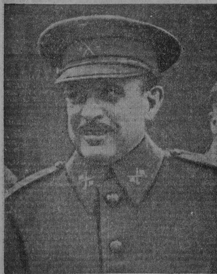
El general conde de Jordana.