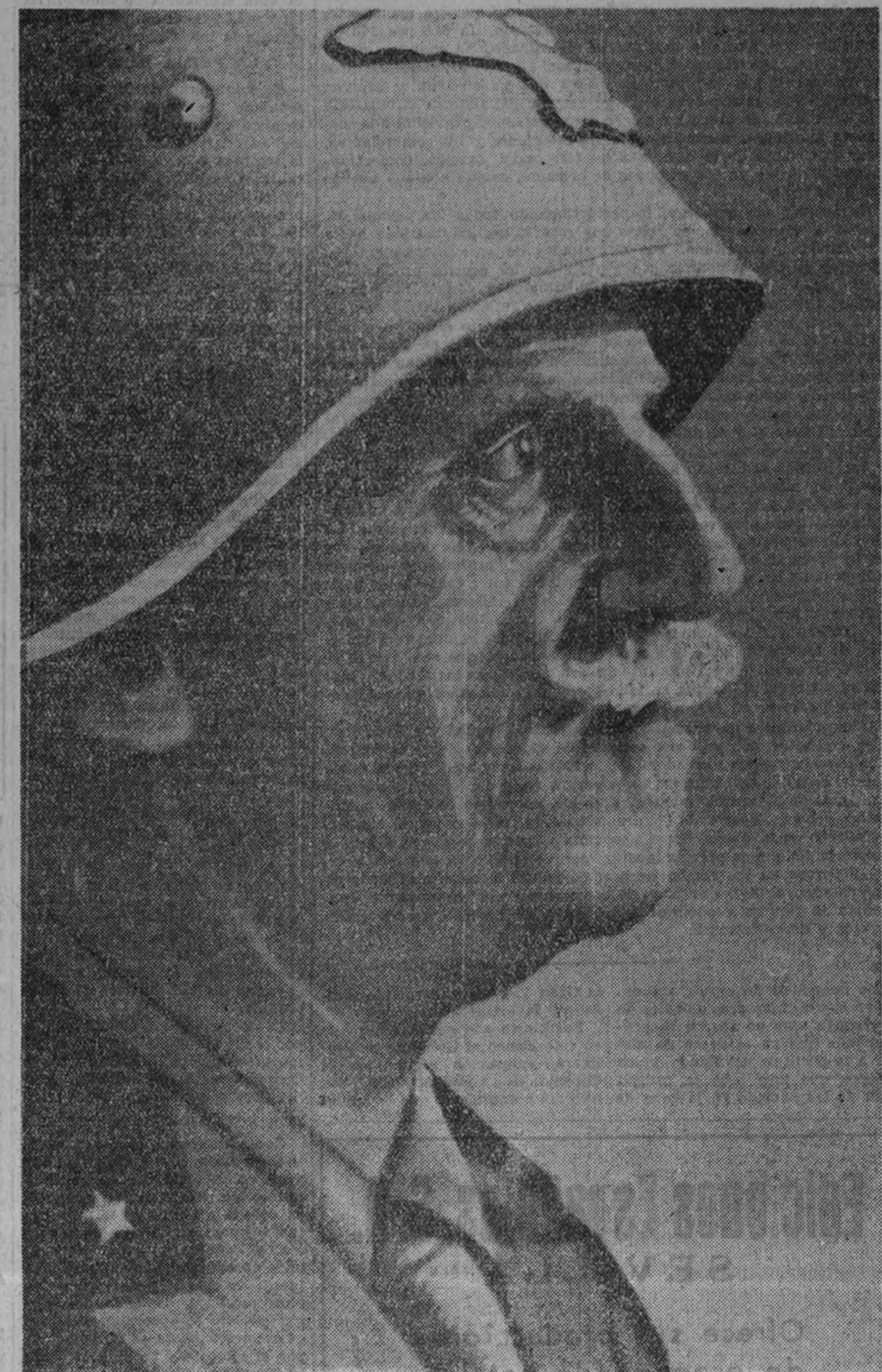
El Rey Emperador Víctor Manuel III.

hacia ya largo tiempo con los brazos abiertos al Ejército italiano liberador, y excepto algunos bandidos, nadie hizo oposición. La mejor solución para la crisis del país es ofrecer la corona de Albania al Rey Víctor Manuel III. (Aclamaciones entusiásticas.) La potencia de Italia es la defensa más segura para las fronteras albanesas. Queda así asegurada la defensa general, la unión nacional y la soberanía albanesa. Albania conservará su bandera, que siempre flotó al lado de la bandera italiana. (Nuevas aclamaciones.) Albania tendrá finalmente una organización de país moderno, y con la ayuda del Gobierno italiano tendrá obras públicas, beneficios morales y materiales, y, sobre todo, sus propias escuelas, que desarrollarán el alfabetismo y asegurarán al pueblo la cultura necesaria.”