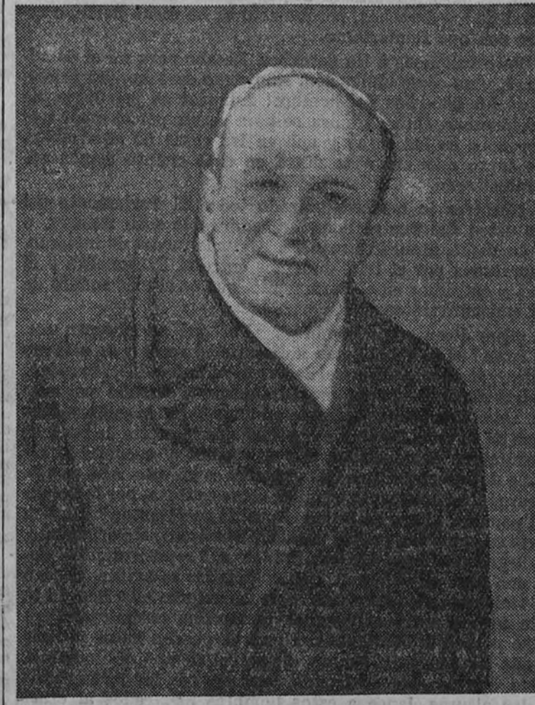
Último retrato de D. Serafín Álvarez Quintero, hecho dos meses antes de su muerte.

Ayer mañana, de once a doce, en la iglesia de los Padres Carmelitas, de la calle de Ayala, se han dicho varias misas por el alma de D. Serafín Álvarez Quintero, con motivo de cumplirse el primer aniversario de la muerte del autor ilustre.