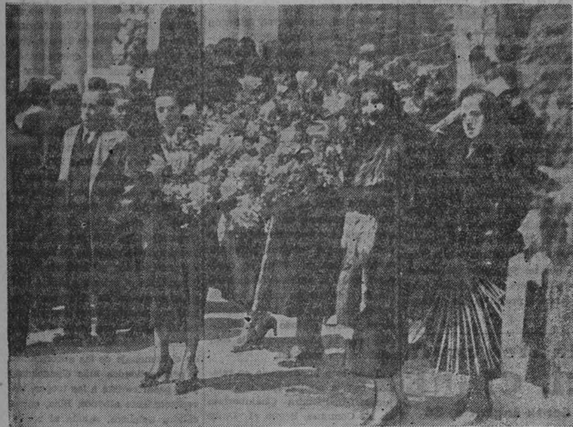
Actrices de los teatros de Madrid antes de depositar su ofrenda de flores en el monumento

RIOJANEIRO 11.—El presidente ha entregado las medallas conmemorativas del campeonato mundial a los jugadores que tomaron parte en el certamen, en el cual el Brasil obtuvo el tercer lugar. El acto se celebrará mañana. El embajador mejicano en Riojaneiro, Veloz González, ha visitado al candelero de Aranha, a fin de señalar la fecha de la entrega de credenciales al presidente Vargas. (Efe.)