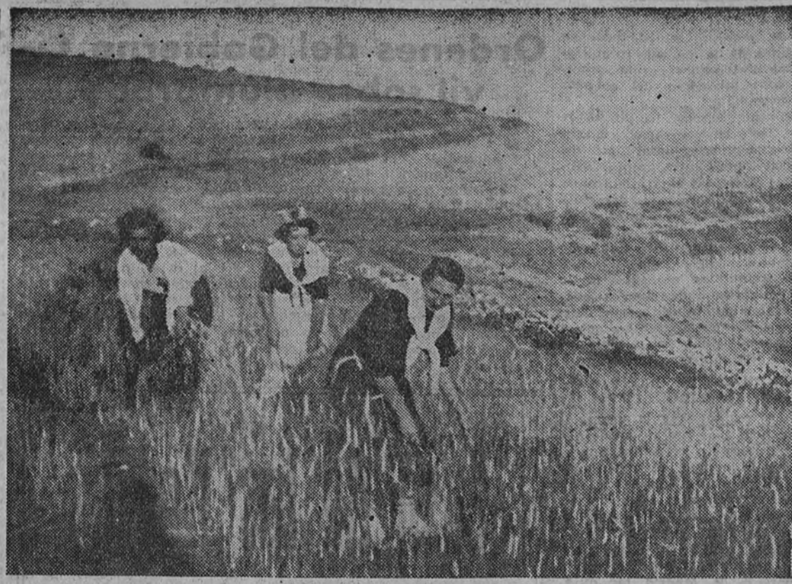
Mujeres de la sección femenina de F. E. T. y de las J. O. N. S. traen a la luz el engrandecimiento de la nueva España

Por la tarde, los embajadores de España en el Quirinal han reunido a la colonia de España para celebrar el advenimiento de la paz victoriosa en la Patria común. En medio de gran entusiasmo, el embajador leyó el telegrama que dirige al Caudillo, y que dice así: "Después de haber asistido piadosamente esta mañana al solemne Te Deum organizado por el embajador cerca de la Santa Sede en acción de gracias por victorioso término de la guerra, colonia española reunida ahora en rededor, con unánime entusiasmo, manifiesta profunda gratitud ante