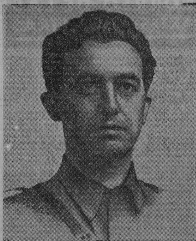
Onésimo Redondo, uno de los primeros y de los mejores de F. E. T. y de las J. O. N. S., que cayó en el cumplimiento de su deber, al iniciarse nuestro glorioso Movimiento, asesinado por el plomo marxista.