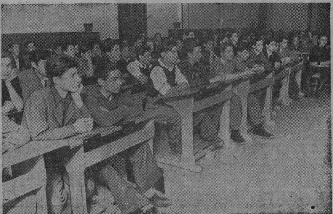
Con atención perfecta, estos muchachos escuchan las lecciones que habrán de dotarlos de las aptitudes necesarias para ser jefes de centurias de falanges o de escuadras en la Organización Juvenil.

Al finalizar sus palabras, los trescientos muchachos cursillistas, firmes y brazo en alto, cantaron los himnos de la Juventud y respondieron entusiásticamente a las consignas y vitores al Caudillo dados por el consejero nacional de