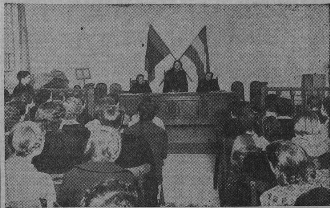
Cursillos de mandos de Organización Juvenil femenina.—La regidora central habla a las alumnas

Labor de las organizaciones. Cursos femeninos. Palabras de la regidora central. Mandos masculinos. Habla el secretario nacional de O. J.