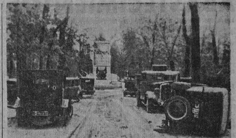
Los bellos jardines y paseos del Retiro se ven con estas huellas inconfundibles de la barbarie "roja"; destrucción, suciedad, abandono... (Foto Contreras y Vilaseca.)

Se le acusa de ser el eterno vacilante, y dicen que necesita más tiempo para elaborar un decreto, que Hitler o Mussolini para apoderarse de una nación entera. (Efe.)