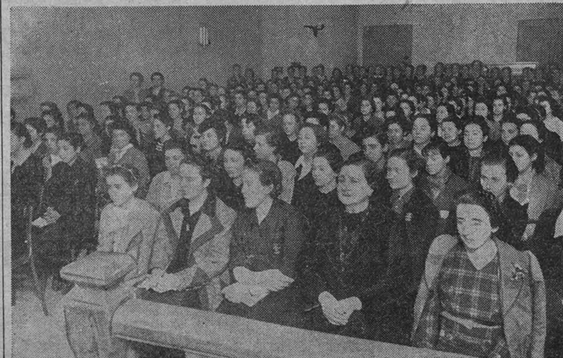
Las muchachas de la Organización Juvenil madrileña en la primera sección de los cursillos de aptitud

Unidad entre las clases de España. Unidad entre las tierras de España. Unidad en el hombre y entre los hombres de España