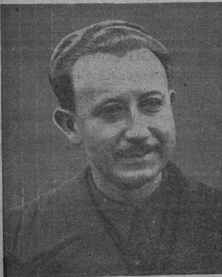
Don Pedro González Bueno, ministro de Organización y Acción Sindical

PARIS 13.—Mañana por la tarde se reunirá en el ministerio de la Guerra, bajo la presidencia de Daladier, la Comisión encargada de estudiar la situación de los refugiados españoles que se encuentran actualmente en Francia. Asistirán a esta reunión, entre otras personalidades, Bonnet, Sarraut y Quevillat. (Efe.)