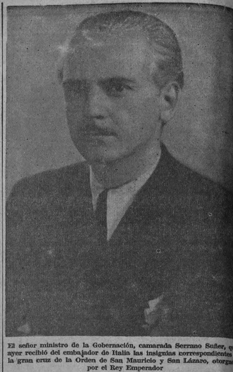
El señor ministro de la Gobernación, camarada Serrano Suñer, que ayer recibió del embajador de Italia las insignias correspondientes a la gran cruz de la Orden de San Mauricio y San Lázaro, otorgada por el Rey Emperador

ROMA 13.—La autodesición nacional albanesa cierra un largo proceso histórico de solidaridad de dos pueblos que viven desde