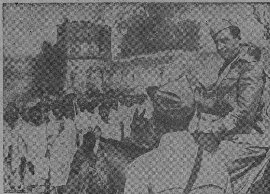
STARACE, SECRETARIO GENERAL DEL PARTIDO FASCISTA

un gran desfile militar de unidades del Ejército del Sur, que, al mando del general Queipo de Llano, se han cubierto de gloria a través de toda la campaña.