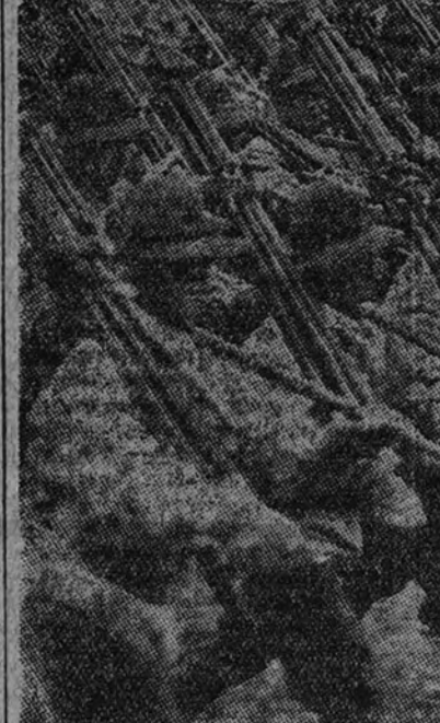
Los países totalitarios hacen de su juventud milicias disciplinadas, de las que no está ausente la alegría, como puede verse en estos esquiadores italianos, que desfilan marciales y optimistas.