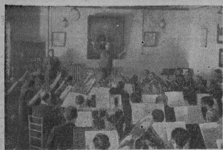
La Banda Municipal de Madrid ensaya el programa que los madrileños podrán escuchar el próximo domingo ante las ruinas de la Ciudad Universitaria.

TIVOLI.—4,30, 6,30 y 10,30. Noticiario español número 3 (pequeño vagabundo (Brent).