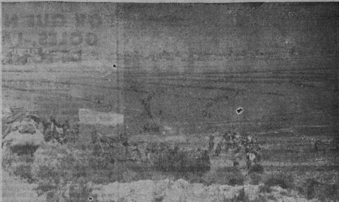
La 5.ª Bandera de la Legión asalta el cinturón de hierro catalán. Al fondo, los bombazos de mano.