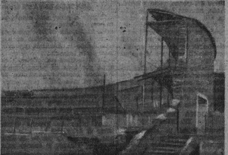
Cómo quedó la plaza después de estallar el polvorín

La plaza de toros de Tetuán; fué construída como corral de en-