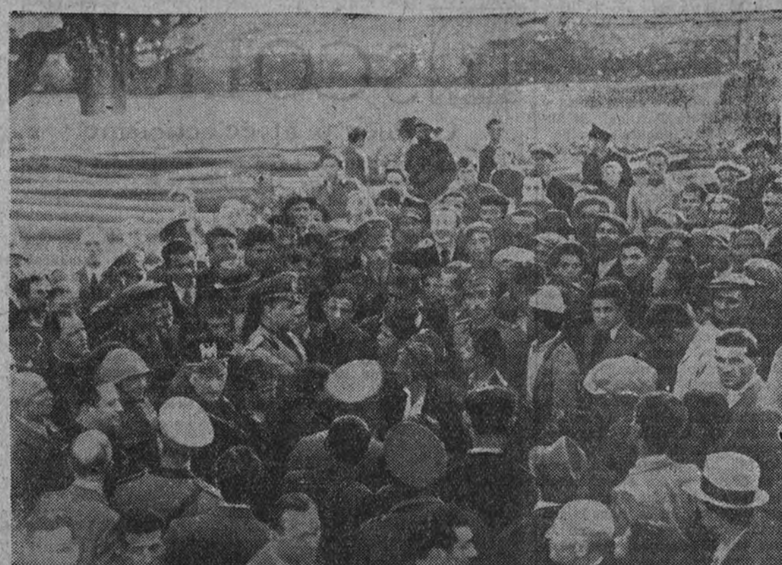
Al llegar el ministro italiano con de Ciano a Tirana fué cariñosamente rodeado por albaneses y elementos de la colonia italiana, que le tributaron un magnífico recibimiento

Madrid: Ha demostrado durante los meses de dominio "rojo" su acendrado espíritu de sacrificio y de patriotismo. Sabemos que podemos contar con ese espíritu para la labor de reconstrucción y de mejora. Sabemos que de dar más que nadie, mejor que nadie, porque ha sufrido como nadie. Sabemos que su suscripción en Seguros, 6 de una FICHA AZUL dará nuevos bríos a la gran obra del Auxilio Social.