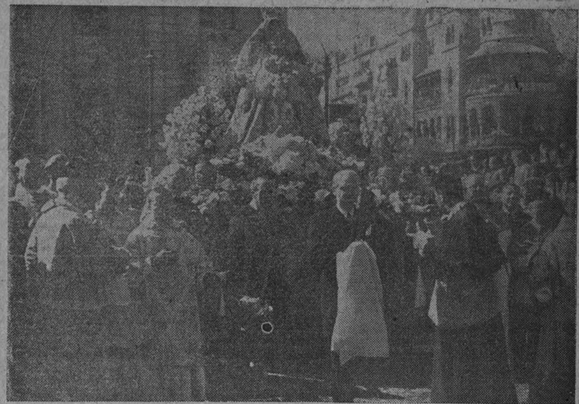
La Virgen de los Reyes, Patrona de Sevilla, en procesión, con asistencia del Caudillo y representantes del Gobierno y el Ejército, desfiló por las calles sevillanas en acción de gracias por el final victorioso de la guerra. Ante la sagrada imagen, el ministro de la Gobernación, Sr. Serrano Suñer, mereció el alto honor de llevar en sus manos la espada del Rey San Fernando