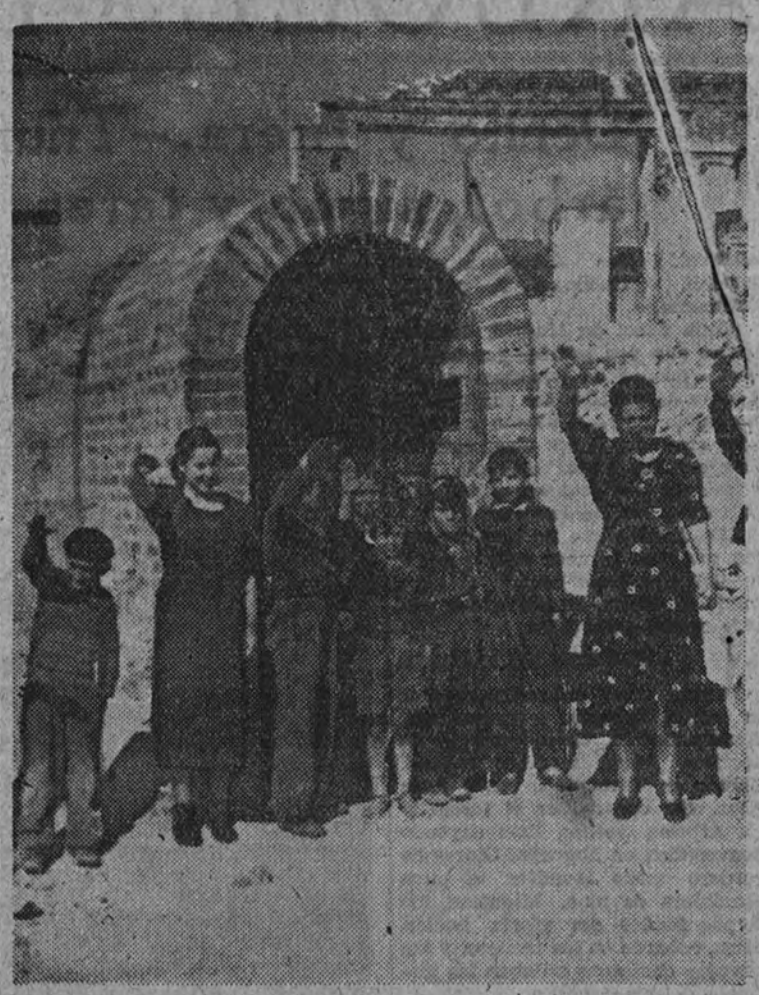
Una de las bocas de los refugios construídos bajo la plaza

A pesar de tantas variaciones, la tramitación de madera que sirvió para armar sus partes superiores, sin estilo definido, la primera vez ha subsistido hasta el último momento. En el cerco de tablas que con los salientes burdos componía el anillo había mucha madera de la empleada también en su primera construcción.