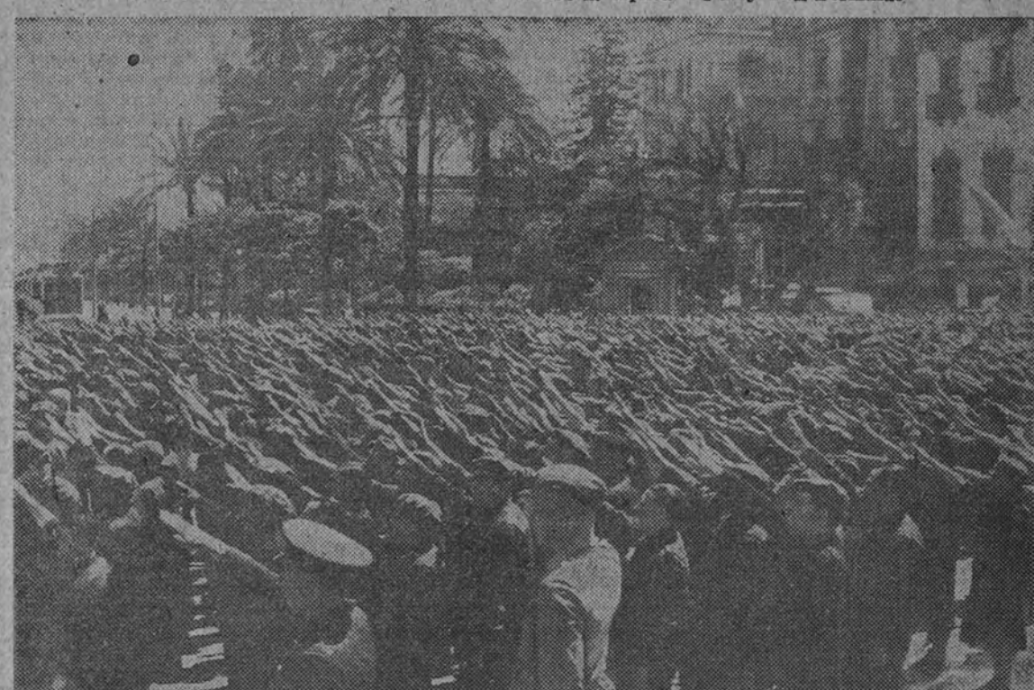
Después de escuchar las palabras del Caudillo, vibrante de emoción, el pueblo sevillano cantó el himno de F. E. T. y de las J. O. N. S. brazo en alto

donde el recibimiento tributado revistió caracteres apoteóticos. (Cifra.)