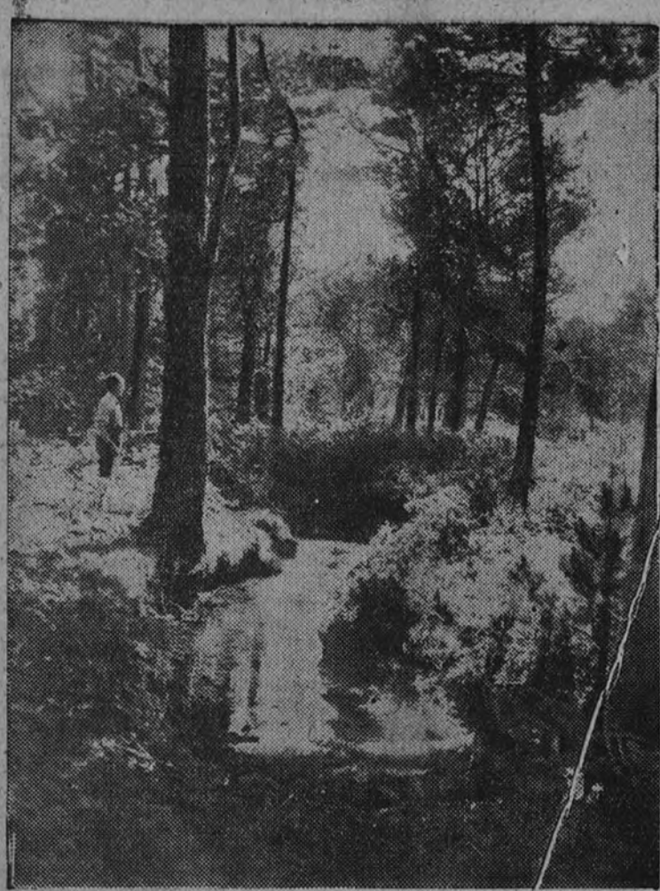
La gracia del agua y del árbol vuelve con la España de Franco

Dentro y fuera.--Triunfo del cemento.--El árbol, signo y tarea de primera juventud