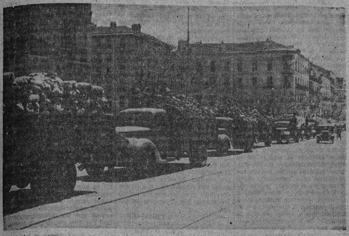
Varios de los 250 camiones que conducían legumbres, hortalizas y otros víveres que envía Barcelona a su hermana Madrid