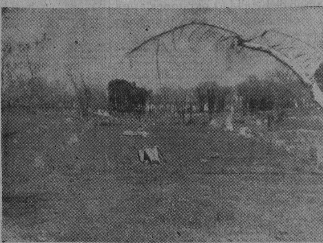
Huellas inconfundibles del hacha marxista en las afueras de Madrid

La otra horda, la desarmada, furtiva retaguardia de la compraventa, "producción" feña y cazaba conejos. Se pagaba bien la carne agria en los mercados clandestinos del hambre. El procedimiento era