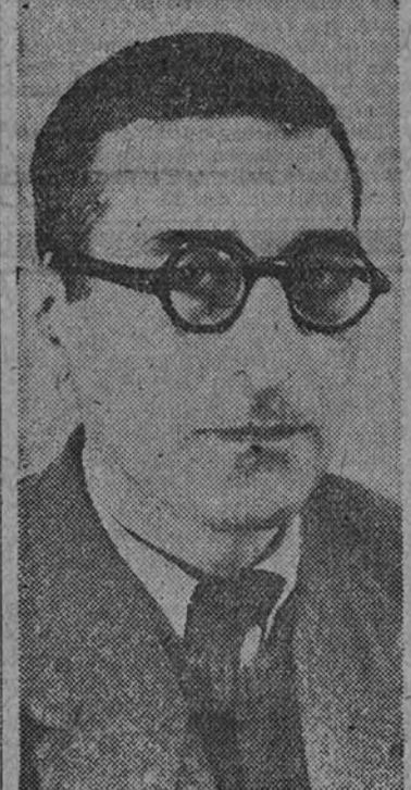
Sánchez Mazas, dirigió anoche desde el micrófono de Radio Nacional un mensaje a Italia con motivo de las fiestas del aniversario de la fundación de Roma.