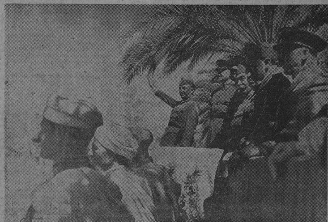
En el gran desfile de la Victoria, celebrado en Sevilla, en la tribuna instalada en el paseo de las Palmeras, el Generalísimo saluda el paso de las tropas

A las siete de la tarde emprendió Su Excelencia el regreso a Sevilla, acompañado hasta el límite de la provincia por las autoridades. En todos los pueblos del recorrido ha despertado un gran fervor patriótico el paso del Jefe del Estado, manifestándose el entusiasmo con exteriorizaciones fervorosas en los pueblos de La Carlota, Estija y Camóna.