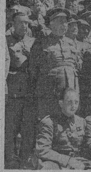
El Caudillo, acompañado de izquierda a derecha—por los generales Orgaz, Dávila, Yagüe, Queipo de Llano, Martín Moreno, Borbón y Llaneras, al terminar el vino de honor que le fué ofrecido por la oficialidad de las tropas que tomaron parte en el gran desfile de la Victoria en Sevilla.

La juventud portuguesa abraza fraternalmente a la española en estos momentos de victoria, lo mismo que lo hiciera en los primeros días del Movimiento salvador de España. Dedicó un cariñoso saludo a F. E. T. y de las J. O. N. S. al volver hoy con los cinco rosas de la paz, que han de ser cinco brotes de la potencialidad política y social de la organización. Terminó su brindis con