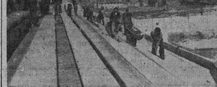
Tres aspectos de las obras que con toda actividad se realizan en el campo del Atlético, donde se jugará el próximo día 2 el primer partido de fútbol.

Adjunto ofrecemos a nuestros lectores una información gráfica completa, donde encontrará la seguridad de que nuestras noticias no son ilusorias, sino que están referendadas por la realidad. Desde hace días, numerosos obreros han regado con el sudor de su frente el campo de Vallecas. No se trataba de jugadores, de "obreritos del cuero", se trataba de obreros de pico y pala. En unos cuantos días el campo, despojado de la mugre y de la cochinilla "roja" que escondía su hierba, lo veremos... sin hierba, porque eso de que estaba escondida era un "bulo", pero, por lo menos, lo veremos limpio, plano, con sus líneas de lechada, esperando al balón y los 23; sin botes de hoja de lata y sin desechos de milicia "roja".