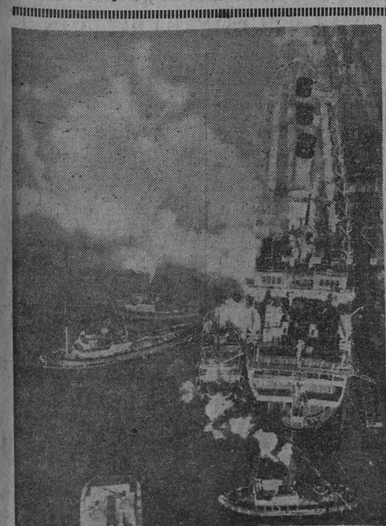
Desde un avión se obtuvo esta vista del "París", al declararse el incendio que lo ha destruido.

Una treinta mil personas, en cifra aproximada, morían anualmente en España víctimas del bacilo de Koch. La importancia de la labor que el Patronato Nacional Antituberculoso realiza, queda expuesta, de manera exacta y simple, al consignar el número aterrador de estos fallecimientos. Que todo el mundo se percate de la trascendencia del quehacer. Tarea sanitaria de entrañable sentido humano. Acción patriótica de enorme alcance. Cumplimiento verdadero de la justicia social que el Caudillo implanta.