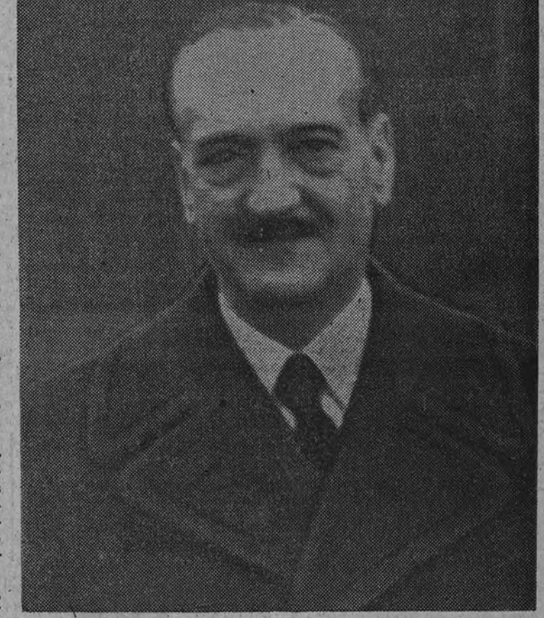
El ministro de Obras Públicas, autor del plan aprobado por el Generalísimo.

Es probable que se advierta al Gobierno alemán la próxima entrada en el Gobierno de Mr. Churchill y de Mr. Eden. Se sabe que estos dos personajes han sido rudemente atacados por la Prensa alemana. Así, se cree que se advertirá al Gobierno alemán antes de la reunión del Reichstag de las intenciones pacíficas de Inglaterra y del alcance puramente defensivo de las medidas tomadas, pero que igualmente se le informará sobre la resolución británica de resistir a