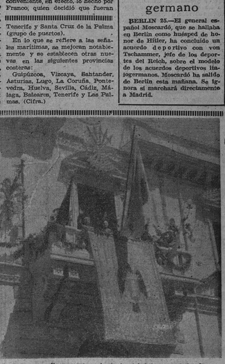
El Generalísimo, rodeado de las autoridades granadinas, corresponde desde el balcón central del Ayuntamiento de Granada a las frenéticas aclamaciones del pueblo congregado en la plaza del Carmen.