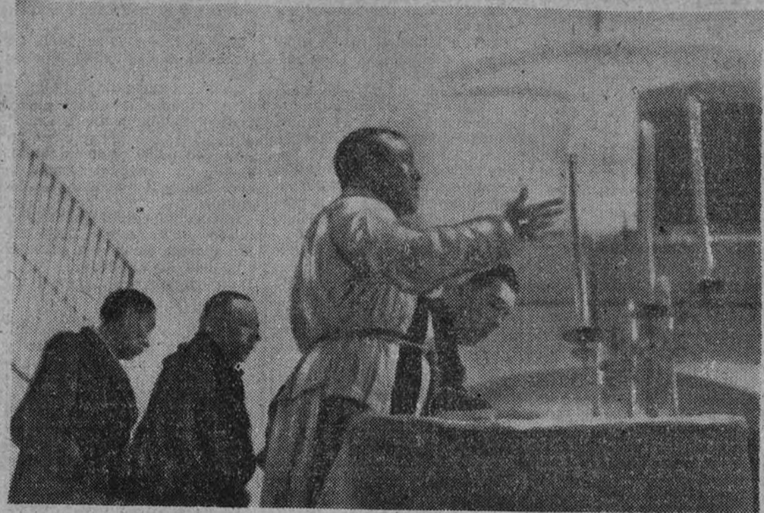
El sacerdote oficiante al pronunciar su plática.

Son tantos los caídos en toda la zona española sojuzgada por el marxismo, que apenas pasará un día sin que tengamos que dar cuenta de algún acto en el que se rinda homenaje y se eleven piadosos suffragios por las almas de tantos mártires como sucumbieron por Dios y por España.