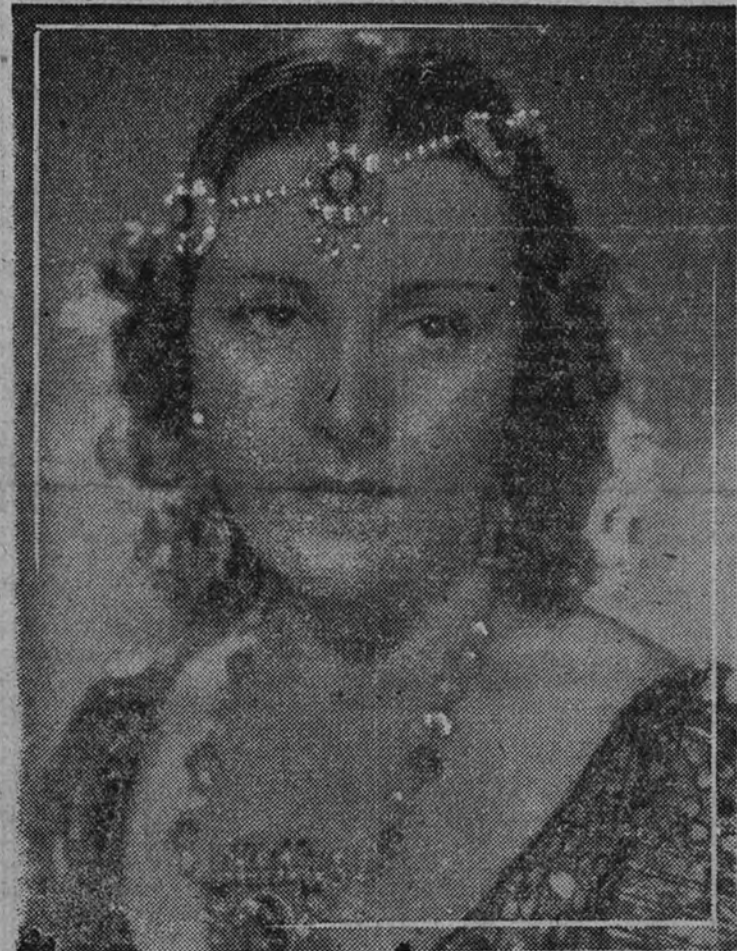
Imperio Argentina, la bellísima estrella del cine español, hace una maravillosa interpretación de la protagonista en "La canción de Aixa", la última película dirigida por el genial director Florián Rey.

Cuando se escriba la historia de la cinematografía, en el ciclo de las épocas, habrá de abrirse un paréntesis dilatado que encierre el título de "Morena clara". Por encima de todas las grandes superproducciones mundiales, el sobrenombre de "una gitanilla española" que inmortalizó la incorporación personal de Imperio Argentina, sobrevivirá a todos los grandes "rolles". La gracia, la picardía, el "ángel" y el desenfado de esa saj de la raza calé no ha de tener nunca una superación posi-