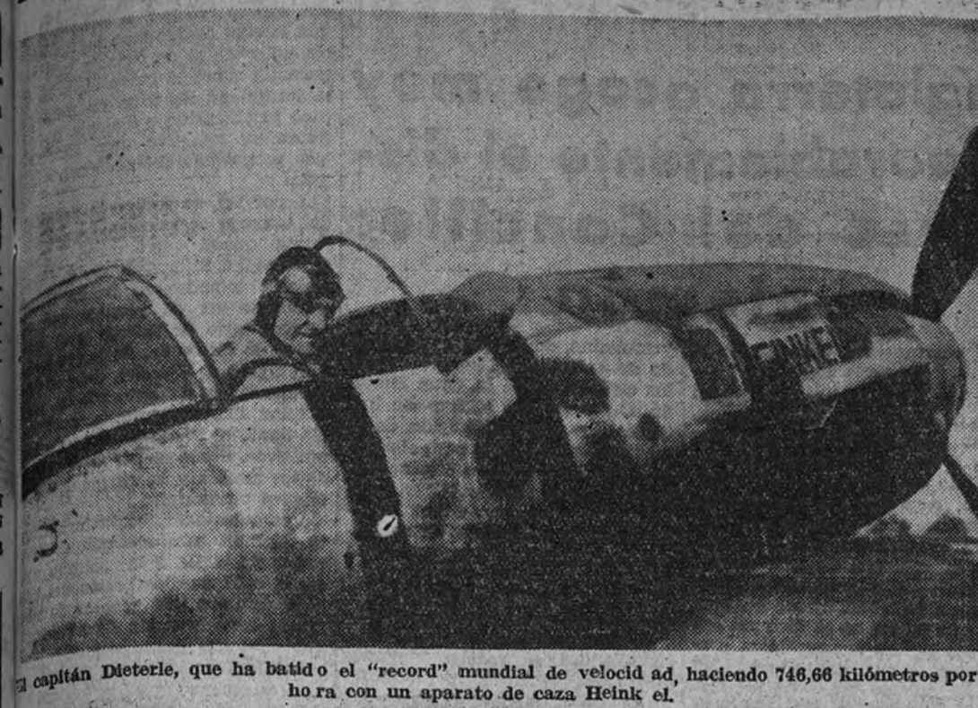
El capitán Dietrich, que ha batido el "record" mundial de velocidad, haciendo 746,66 kilómetros por hora con un aparato de caza Heink el.

PROYECCIONES.—Dos sesiones. Primera sesión, repetida, de 5,30 a 8,30; y segunda, a las 10,30. La reconquista de Málaga y Bajo falsa bandera.