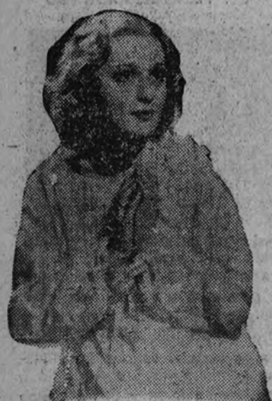
Anna Sten en la película "Noche nupcial", que en unión de Gary Cooper son sus principales intérpretes.

Imperio Argentino avala la primera superproducción española, cuyo coste se eleva a varios millones de pesetas