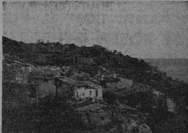
El pueblo de Fontllonga, donde se rompió el frente catalán. Esta es la primera visión que de él tuvimos.