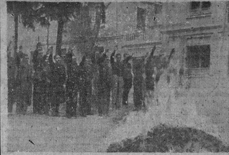
El "Cara al Sol" en la gloria del servicio.