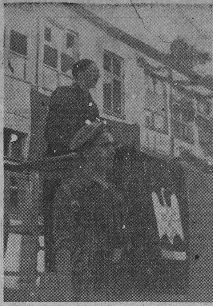
Los camaradas del S. E. U., con palabras de domingo, han hablado en el patio de la Universidad.