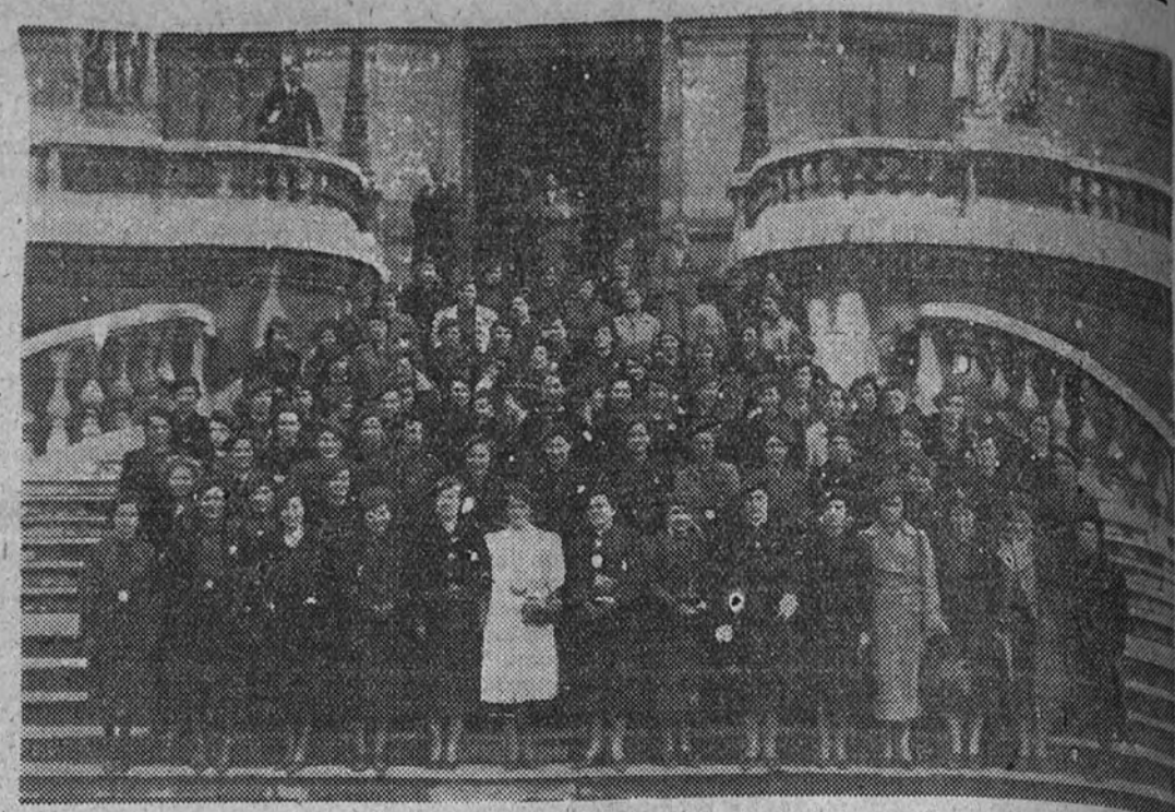
Las camaradas delegadas del Consejo Provincial Femenino de F. E. T. y de las J. O. N. S. de Villacaya, a la salida de uno de los Consejos.

Madrid, a 30 de abril de 1939. Año de la Victoria.