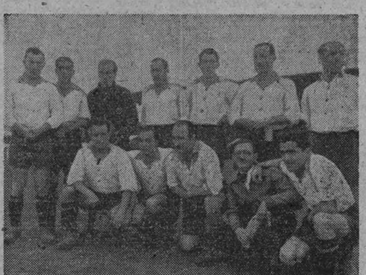
El Deportivo Alavés

El primer gol fue marcado a los veinticinco minutos. Bracero, recogiendo un rechazo corto y aprovechándose que el portero alavés había salido de la puerta, marcó habilidosamente para los aviadores. El gol del empate lo consiguieron los del Alavés en el segundo tiempo, también a los veinticinco minutos, en un momento de dominio. Se trabajó durante unos minutos el estómago al portero de Aviación. En una "melée", el balón se lo pasaron