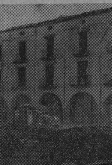
Agramunt.—La Plaza Mayor, convertida en ruinas.

Una mañana, todos en su puesto. Las compañías, formadas. Repletos los bestes de los mulos. Había orden de marchar al pueblo de Doncell, para combatir de nuevo. La gritaría de siempre, los cantos siempre iguales de los marroquíes, que terminan en un alarido guerrero. Cruzamos el puente que tan oportunamente había salvado nuestro comandante de la destrucción, y enfiamos la carretera de Agramunt, donde el día antes había estallado la guerra, que ahora sonaba lejána, más allá de la gran llanada.