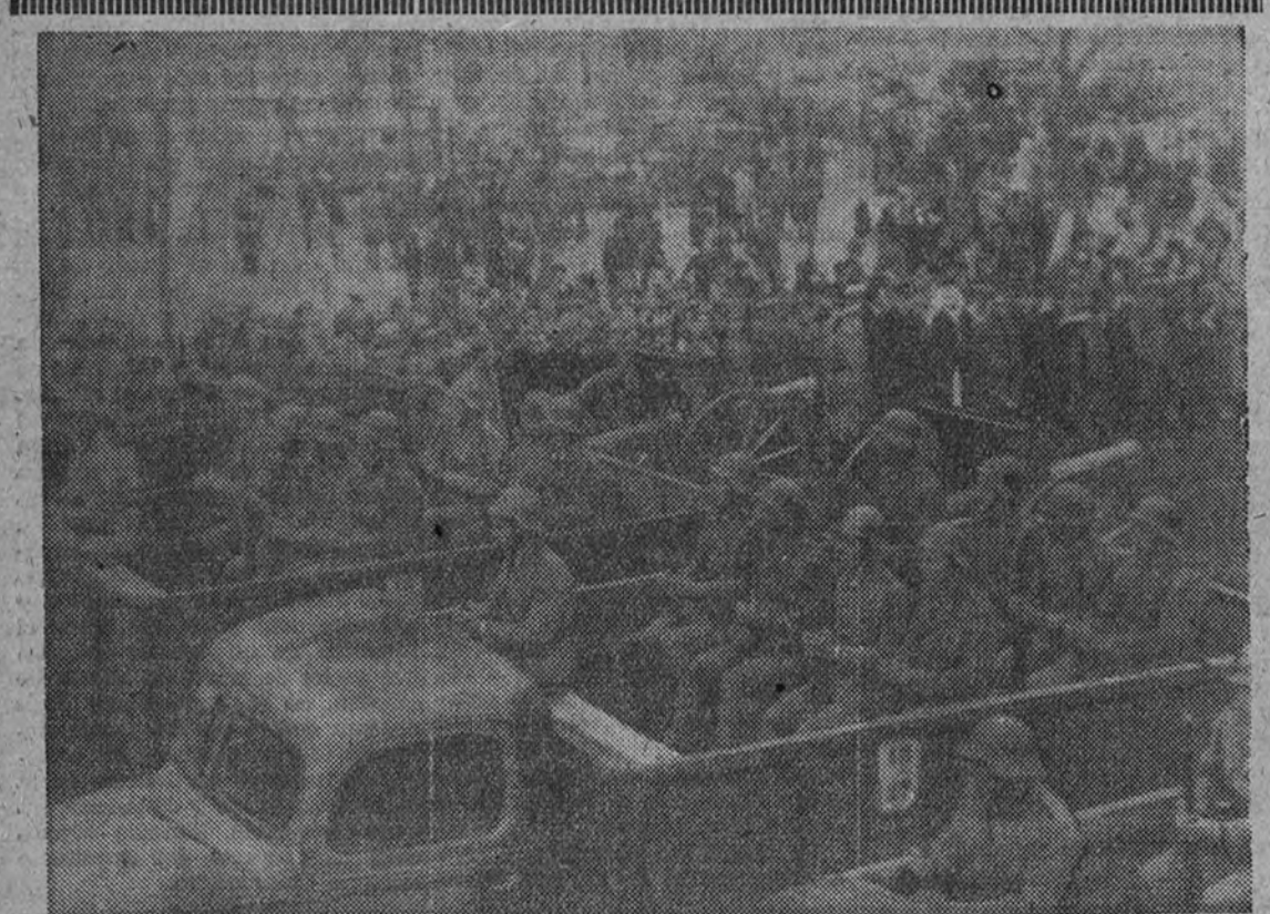
Fuerzas motorizadas que desfilan en ayer con motivo del Dos de Mayo.