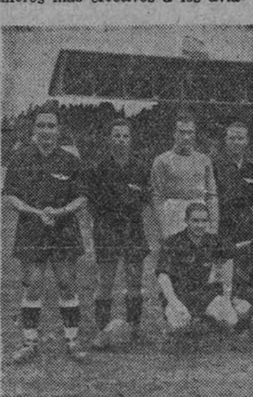
El equipo de Aviación

El partido fue eso: un dominio casi equilibrado. Acaso nos inclináramos por considerar como artillos más efectivos a los aviadores.