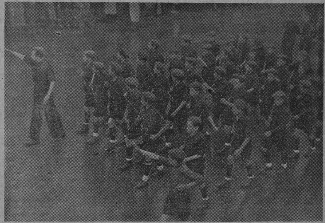
"Pelayos", "flechas" y "cadetes" de la Organización Juvenil madrileña desfilan ayer con motivo de la fiesta nacional del 2 de mayo. En esta foto, llena de gracia y simpatía, los "flechas" desfilan con una marcialidad más sentida que aprendida en el escaso tiempo que han recibido instrucción.