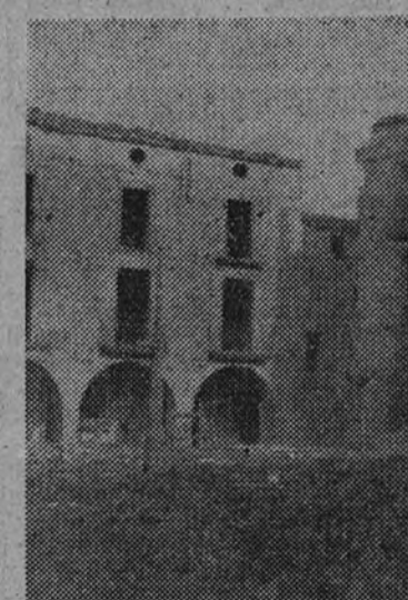
Agramunt.—La Plaza Mayor, convertida en ruinas.

Todo Agramunt estaba removido por los tancazos, por la dinamita. En la plaza mayor, convertida en ruinas, se continuaba el informe sobre