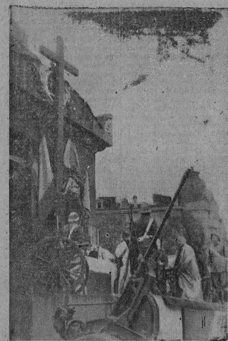
La cruz, la bandera, el cañón y el hombre en uniforme, cuatro símbolos de Imperio.