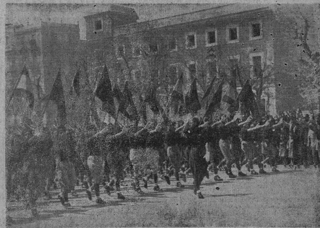
LA BANDERA DE MARRUECOS EN EL DESFILE DEL DOS DE MAYO.

Lord Rushcliffe ha destacado que estas conversaciones tienen que iniciarse más o menos pronto, y la opinión pública inglesa no se opondrá, ciertamente, a que el Gobierno británico realice cuantos esfuerzos sean precisos para reducir la tensión europea. (Efe.)