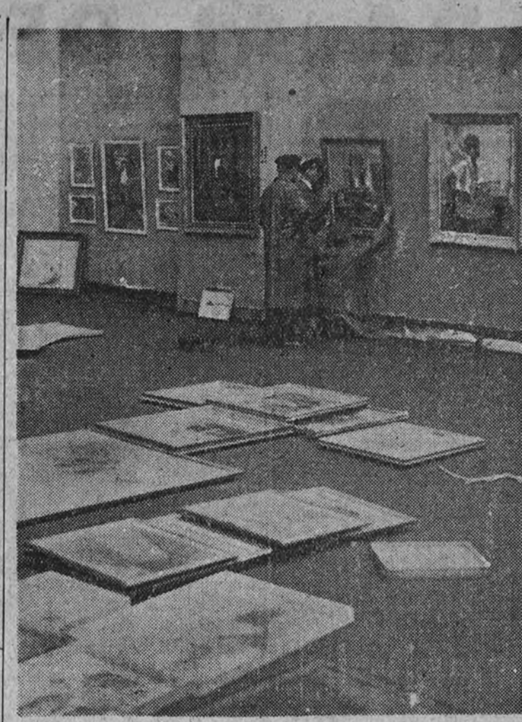
Ante la próxima apertura del Salón anual de los artistas franceses, los cuadros llegan constantemente al Grand Palais de París.