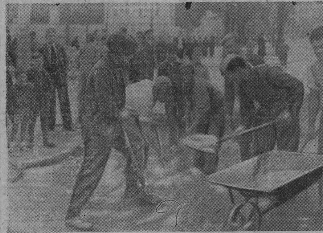
Actividad de palas y rastrillos en las calles del Madrid en vísperas