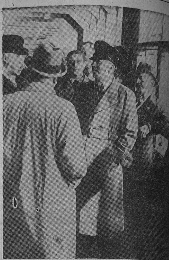
El Canciller Hitler, rodeado de los obreros que viajan en el buque de la Organización "La fuerza por la alegría".

En la capital y otras ciudades han desfilar las tropas ante las autoridades. La conmemoración ha tenido menos solemnidad que los años precedentes, debido a que en estos días no han participado tantos soldados, porque en la actualidad están ausentes de sus guarniciones.