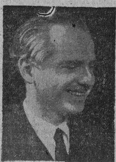
El ministro de la Gobernación, camarada Serrano Suñer

PARIS 3.—"Le Temps" publica una carta, en su sección de correspondencia, en la que se relata la odisea trágica por la que tuvo que pasar el señor Serrano Suñer desde el comienzo de la guerra hasta