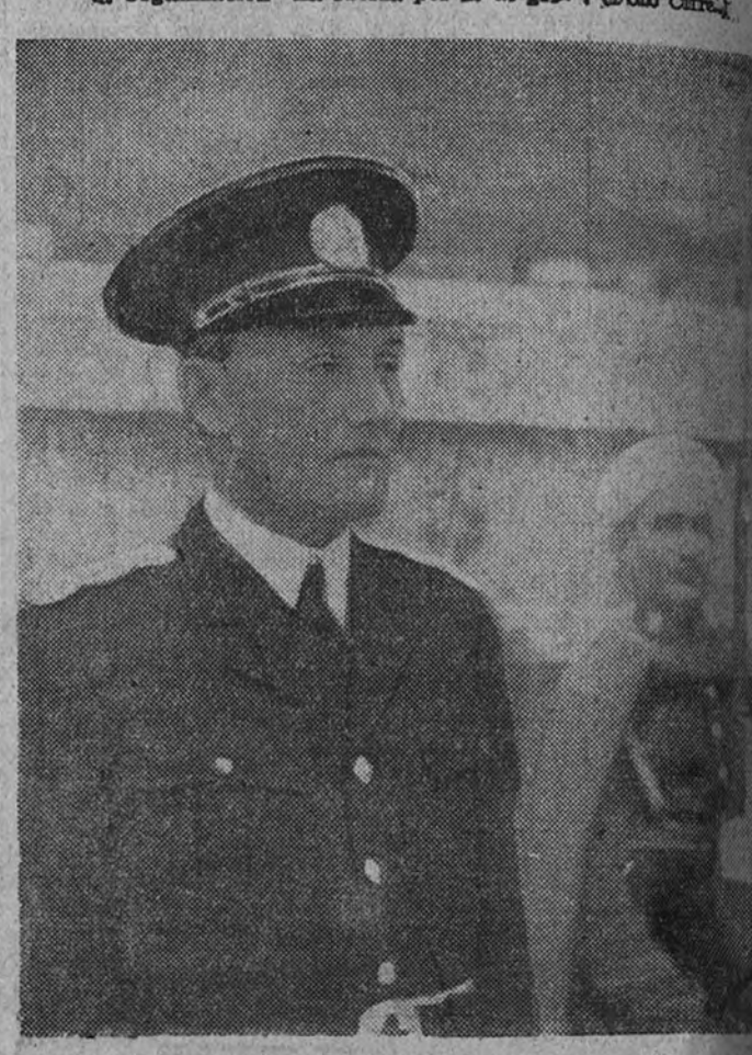
El ministro de Rumania, Federico C. Nano, al salir de la residencia del Generalísimo de presentar sus cartas credenciales.