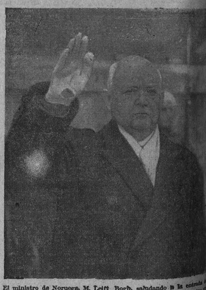
El ministro de Noruega, M. Leif Bogh, saludando a la entrada la residencia de S. E. el Generalísimo, al que presentó sus cartas credenciales.

El Gobierno Daladier y el segundo mandato de Lebrun