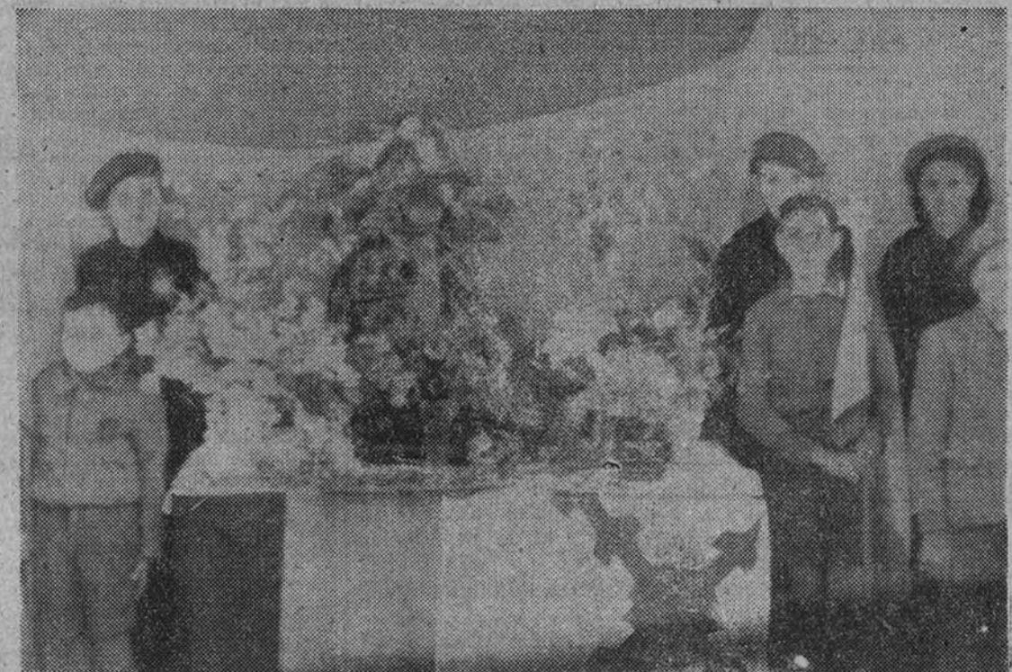
LA CRUZ DE MAYO EN EL PUENTE DE VALLECAS.—Tipismo, tradición y gracia, en la madrileña barriada del Puente de Vallecas han hecho su aparición las mesas petitorias, que atraen ahora a camorras falangistas y de las Organizaciones Juveniles. Entre flores e imágenes religiosas reza el lema "Por el Imperio hacia Dios". Quédo ahuyentada para siempre la sombra siniestra del marxismo. (Foto Contreras)

La Policía ha detenido a dos individuos. (Efe.)