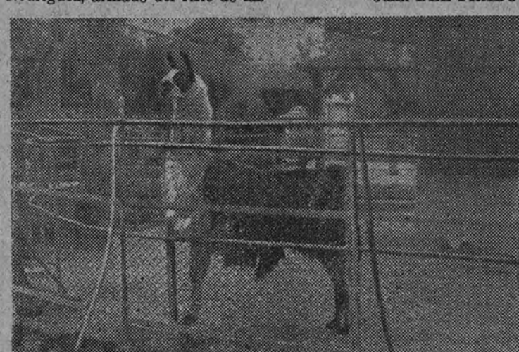
La llama, que luego es una de las llamas del infierno.