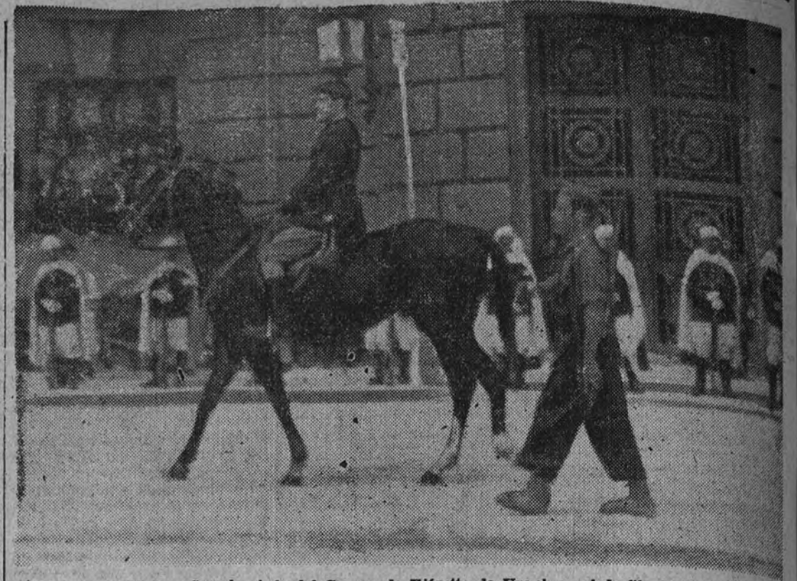
El general Muñoz Grande, jefe del Cuerpo de Ejército de Urgel, en el desfile de Valencia.