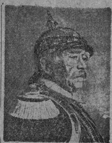
Príncipe Otto von Bismarck

Esto no quita para que la idea del equilibrio europeo se pierda en la noche de los tiempos, y que la tendencia a él sea tan vieja como la vida de los Estados europeos. Pero para el inglés me-