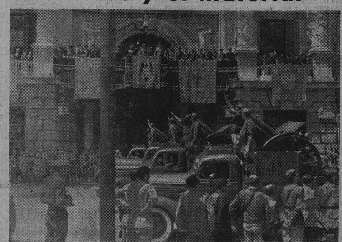
La artillería motorizada desfila en Valencia ante el Caudillo.