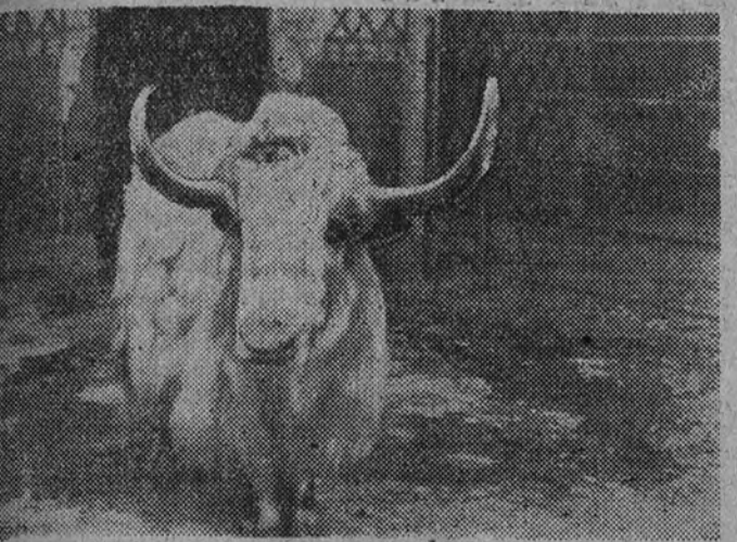
"Yack", tibetano melancólico, de lida más que difícil.