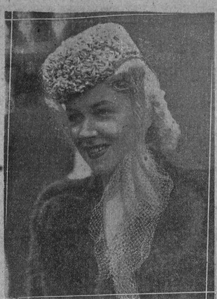
Modelo de sombrero, última novedad de la moda parisense, exhibido en las carreras de Longchamp, en París.

Art. 3.º El Servicio Nacional de Sindicatos de este ministerio prestará a la Comisión los elementos y servicios de todo orden que pudiera necesitar; esta Comisión quedará autorizada para requerir de los centros y dependencias oficiales las informaciones y datos que necesite para su labor. (Cifra.)