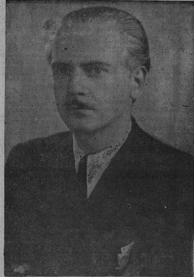
Ramón Serrano Suñer

PARIS 11.—La sesión de la Cámara ha comenzado a las tres y