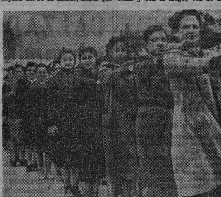
El desfile requiere entrenamiento y disciplina, que se cumplen exactamente

La Organización Juvenil de Falange Española Tradicionalista y de las J. O. N. S. ha sido la revelación que nos reservaba Madrid. La juventud madrileña, de uno y otro sexo, que conocía, por haber aprendido en la escuela, sólo el ritual falangista, sino también el estilo disciplinado y militar, que da rango y tono al nuevo Estado, ha demostrado, en el corto espacio de tiempo que nos separa del 28 de marzo, hasta qué