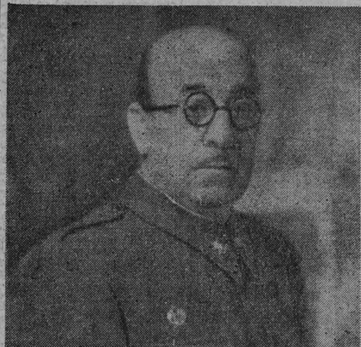
El general Moscardo

Conferenciaron sobre los proyectos deportivos que se realizarán en la Casa de Campo