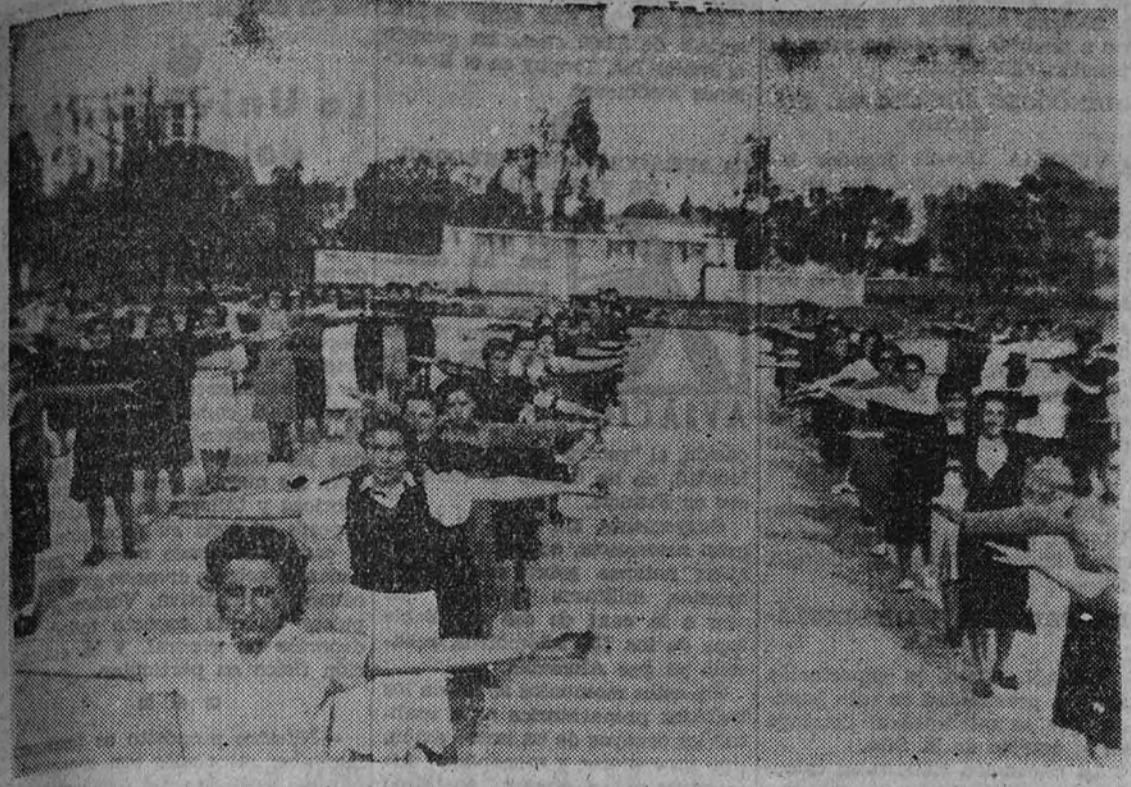
Con gran entusiasmo, todos los días las Organizaciones Juveniles hacen ejercicios gimnásticos