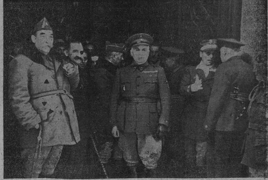
Los generales Saliquet, Espinosa de los Monteros y Millán Astray a la salida de la misa celebrada por los caídos de la Escuela Superior de Guerra

MOSCÚ 11.—El diario "Izvestia" publica hoy un importante editorial, en que expone el punto de vista soviético sobre las negociaciones con Inglaterra. Este artículo, titulado "La situación internacional", es, al mismo tiempo, una respuesta a la declaración hecha ayer en la Cámara por Chamberlain. El órgano oficial bolchevique afirma que la Unión Soviética mantiene la opinión de que si Inglaterra y Francia, desean realmente establecer una barrera contra la agresión, deben organizar un frente común de obligaciones de asistencia, al menos entre las tres grandes potencias: Francia, Gran Bretaña y la U. R. S. S. Estas tres potencias, unidas entre ellas por un pacto de asistencia basado en la reciprocidad, podrán entonces garantizar a los otros Estados de la Europa central y oriental que se vean amenazados por una agresión. El diario lamenta que esta sugerencia no haya encontrado en Londres y París una comprensión suficiente. En las contraproposiciones del Gobierno británico no se habla de la cuestión del pacto de alianza. "Izvestia" expo-