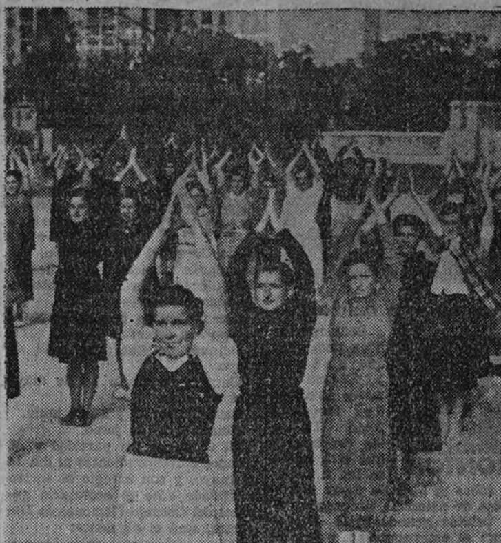
A la voz de mando, las camaradas ejecutan exactamente las órdenes de la entrenadora

La nueva producción del señor Pémán, "La Santa Virreina", cuya lectura acaba de tener lugar en Sevilla, según dimos cuenta ayer, se encuentra en estudio en Barcelona por parte de la compañía Guerrero-Díaz de Mendoza.