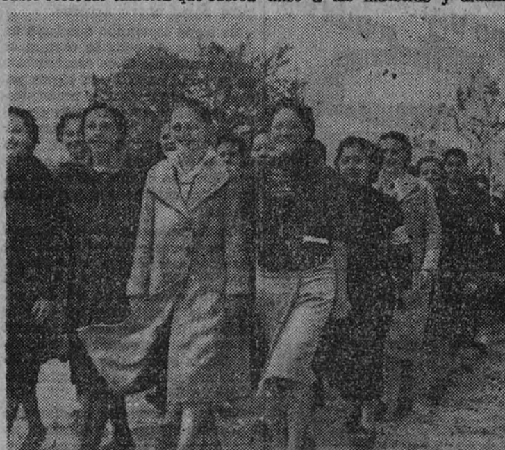
Elastico y alegre el paso deportivo en las mañaneras madrileñas

SE CONCEDE PERMISO A LAS MAESTRAS Y ALUMNAS VITORIA.—El jefe del Servicio Nacional de Primera Enseñanza, señor Toledo, ha enviado un telegrama circular a los inspectores jefes de Primera Enseñanza de todas las provincias concediendo autorización para que faciliten permisos a las maestras y alumnas